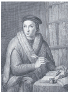
Humanista, filósofo y pedagogo nacido en Valencia en 1493

Las Becas Luis Vives son el resultado de la recopilación de otras becas anteriores que tenían criterios geográficos o de estudios más concretos, para alcanzar un doble objetivo: llegar a un mayor número de países y ampliar la oferta de estudios de máster.