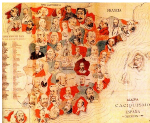
Mapa del caciquismo en España. Revista Gedeón, 1897