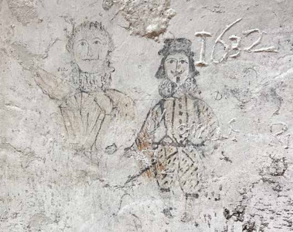
Palazzo Chiaramonte Steri (Palermo)