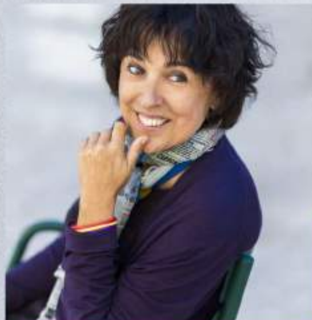
presse ©Philippe Matsas

Correo de contacto: rita.rodriguez@uv.es