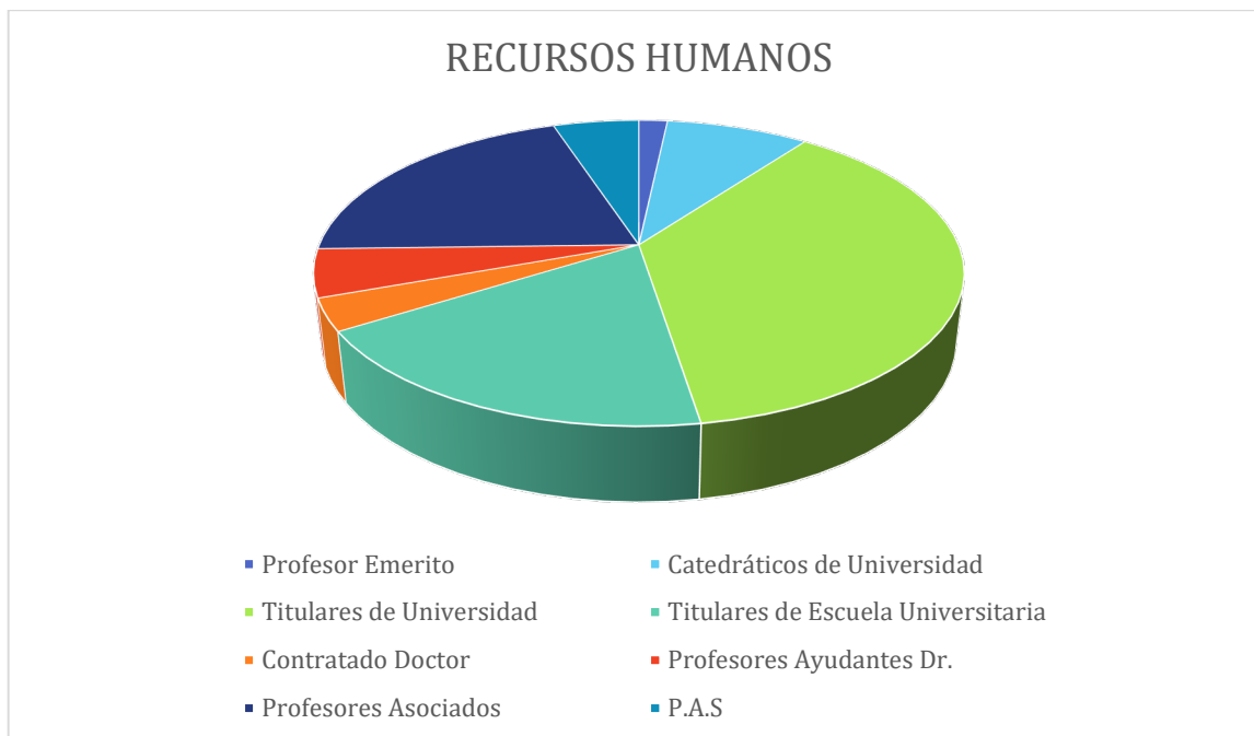
Gráfico 1. Recursos humanos adscritos al Departament de Comptabilitat