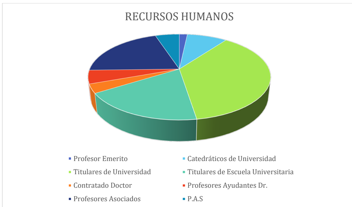
Gráfico 1. Recursos humanos adscritos al Departament de Comptabilitat