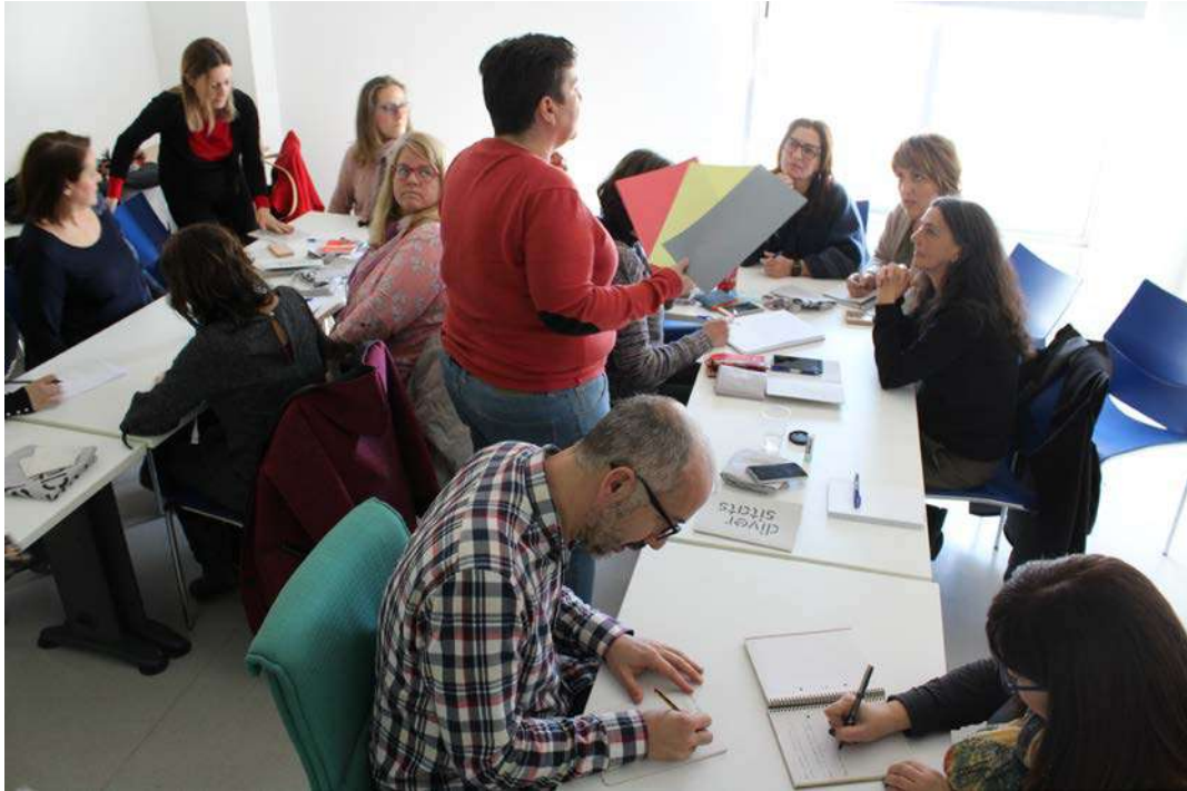
Un moment del curs d'introducció a la diversitat

Des del Vicerectorat d'Igualtat, Diversitat i Sostenibilitat es va organitzar el 25 de gener un curs de formació interna en matèria de diversitat afectivosexual i de gènere per al personal de la Fundació General de la Universitat de València (FGUV).