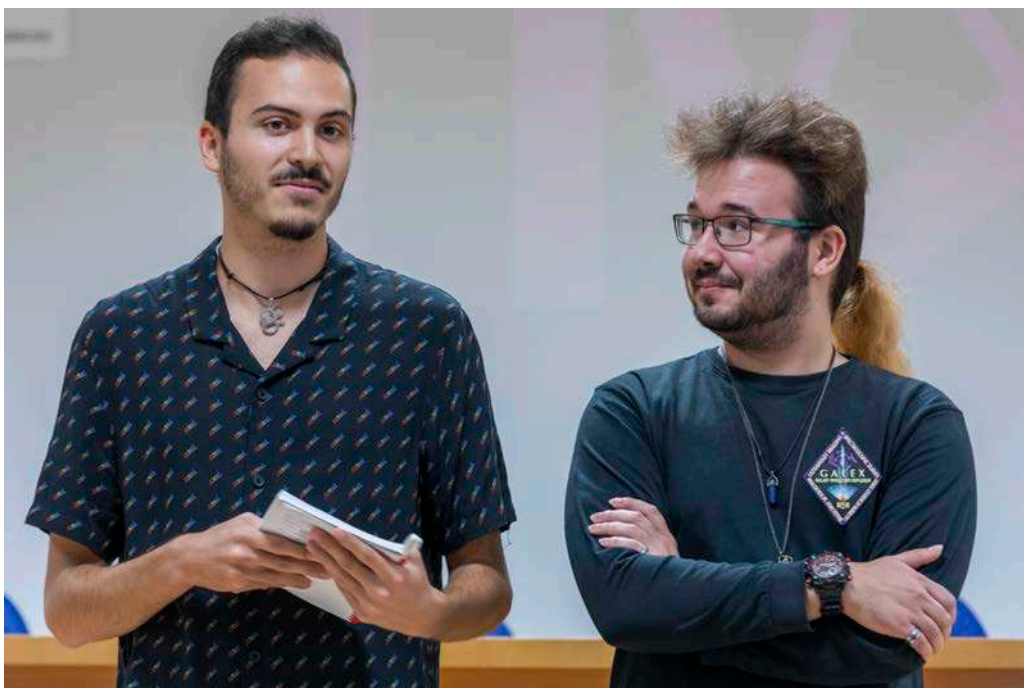
Dos estudiants del col·lectiu Polymorfia presenten el que fan

A la sessió del campus de Blasco Ibáñez, i abans de les projeccions, es va convidar membres dels col·lectius LGTB de la Universitat a presentar el treball que fan. Al campus de Burjassot, es va aprofitar l'ocasió per a donar a conèixer la pretensió d'un grup d'estudiants de crear un col·lectiu LGTB al campus i animar els participants a sumar-se al projecte.