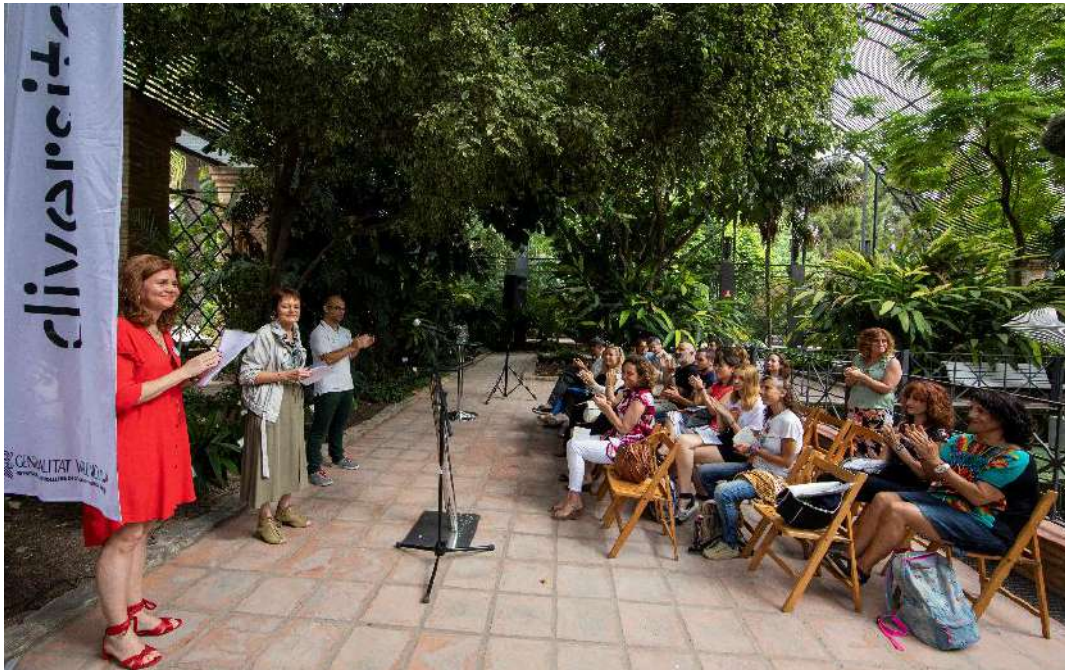
Presentació del protocol