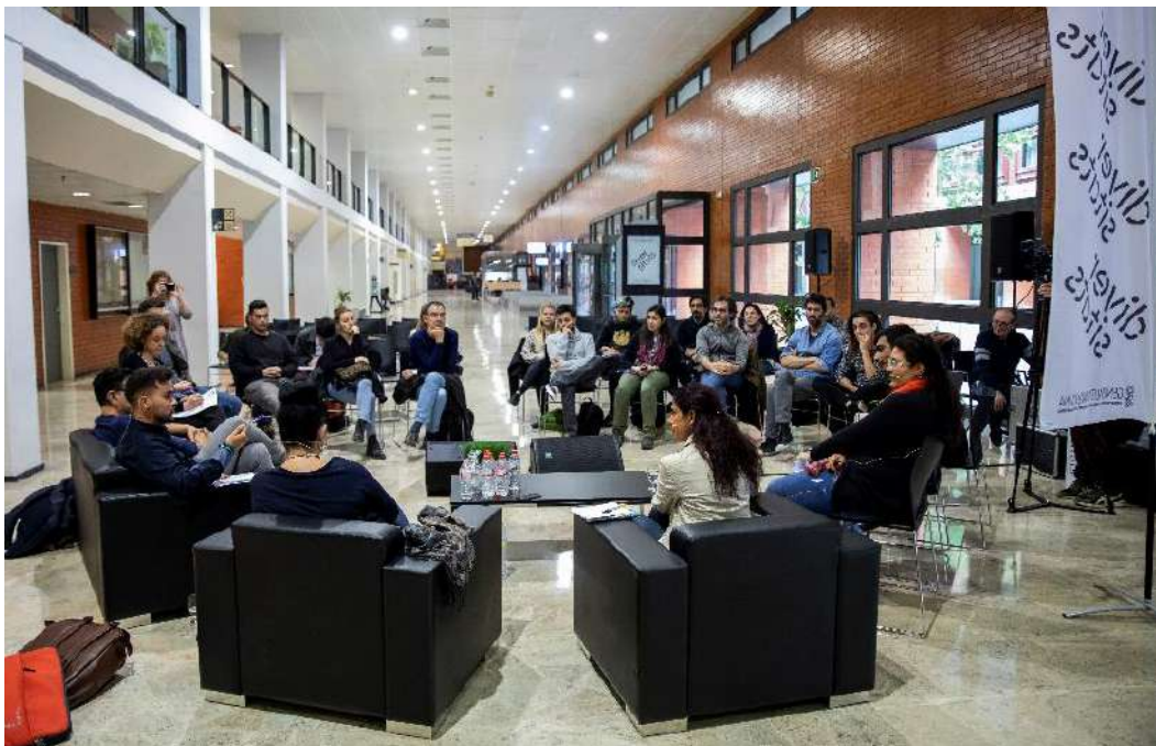
Converses al hall de la Facultat de Dret

Amb motiu de la celebració del Dia Internacional del Poble Gitano, el 8 d'abril, el conversatori va abordar els reptes concrets a la Universitat. Es va parlar, entre altres, de la in/visibilitat de les persones gitanes universitàries; de l'accés a la universitat; el coneixement, reconeixement i difusió de la història, la cultura i la llengua gitana en els continguts docents i en la investigació, així com de l'estigmatització i la falta d'eixides professionals.