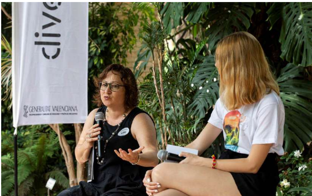
Avanç de resultats del diagnòstic