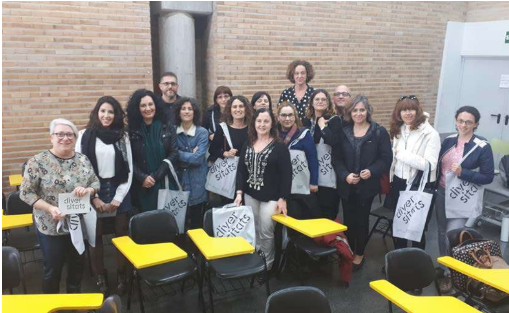
Alguns dels participants al finalitzar el curs

Els valors d'Igualtat, Diversitat i Sostenibilitat han de ser una de les nostres marques diferencials com a Universitat pública. Els marcs normatius vigents insten a incloure la perspectiva de gènere i de sostenibilitat en el desenvolupament de la innovació, el benestar social de la ciutadania, la investigació i l'administració universitària. Les Universitats, a través de les persones que formen part d'elles, tenen la responsabilitat de donar resposta als reptes actuals, generar nous models, transferir el coneixement i generar impacte social.