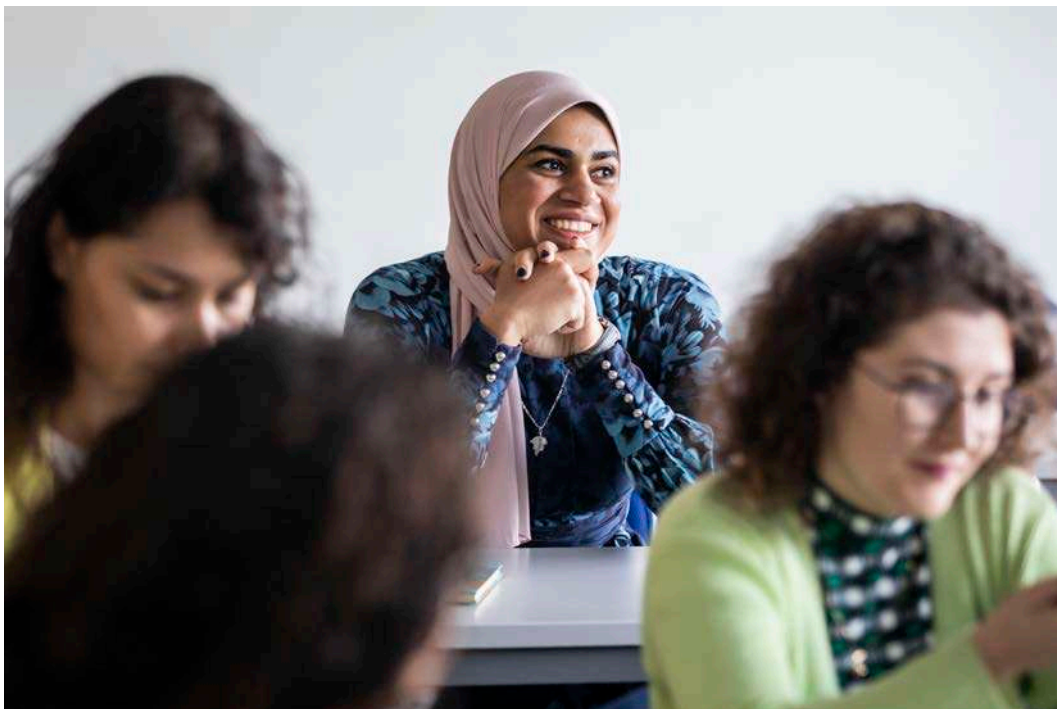
Una de les participants en els tallers

L'últim dels tallers va ser una trobada amb Rubén H. Bermúdez, fotògraf i docent, autor del llibre "Y tú, ¿por qué eres negro?". A la trobada es va parlar de procés creatiu, fotografia, racisme, imaginari col·lectiu, afrodescendència, etc. i es va treballar la relació Fotografia-Arxiu-Universitat. Aquesta sessió es va realitzar el 25 d'octubre, de 10:00 a 14:00, al Campus dels Tarongers.