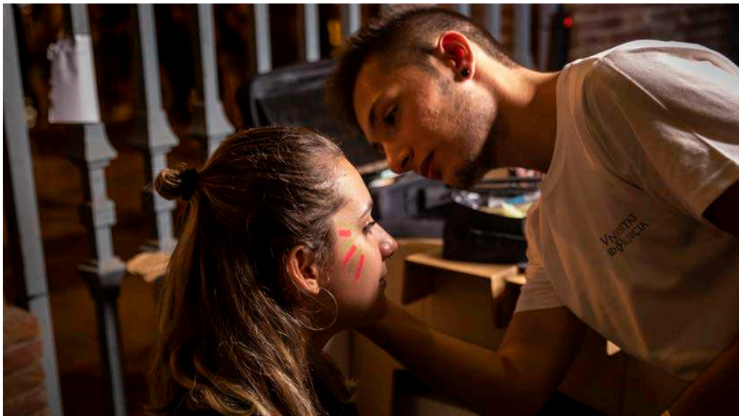
Un dels professionals maquilla una de les participants