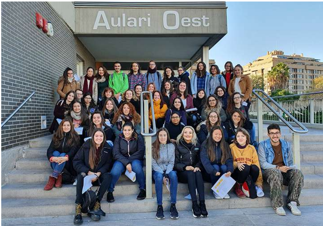
Estudiants participants en l'Espai Experiències de Voluntariat

L'edició d'enguany s'ha ofert a un nombre limitat de participants que, una vegada finalitzada la formació, es convocaran per a una acció de revisió, avaluació i proposta de millores del programa de voluntariat. Les propostes dels participants es tindran en compte per redefinir el programa de cara a properes edicions.