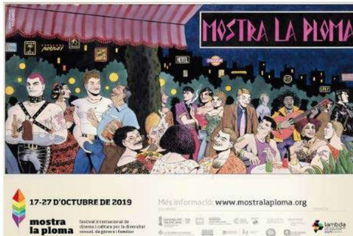
Cartel de la Mostra la Ploma. E.M.

Mostra la Ploma se adentra en el mundo transexual y homenajea a los mayores que salieron del armario.