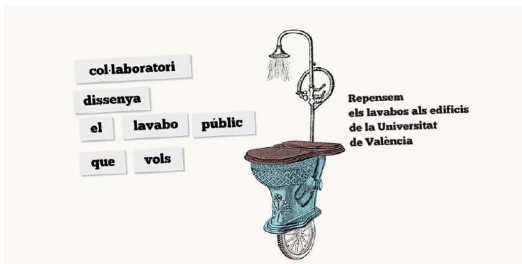
Cartell del Col·laboratori | Disseny: Ángeles Sánchez