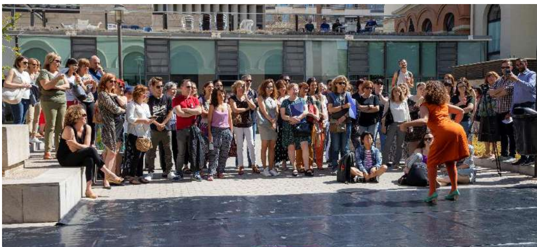
Representació de l'obra Lo inevitable a plaça de Rectorat | Fotografia: Miguel Lorenzo

La peça, que aborda la qüestió de la identitat, de com es construeix i ens construeix el gènere, es va representar a les 11 hores els dies 19 de juny a la plaça Darwin de Rectorat, i el dia 20 de juny davant de la cafeteria del Campus de Burjassot.