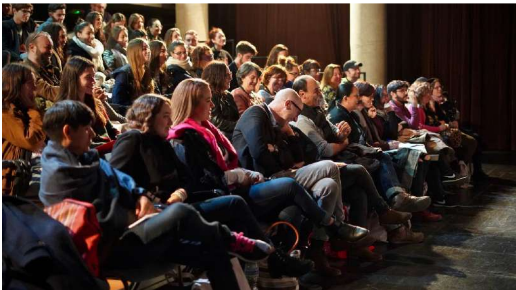
Conversatori “Diversos som tots” a la Matilde Salvador