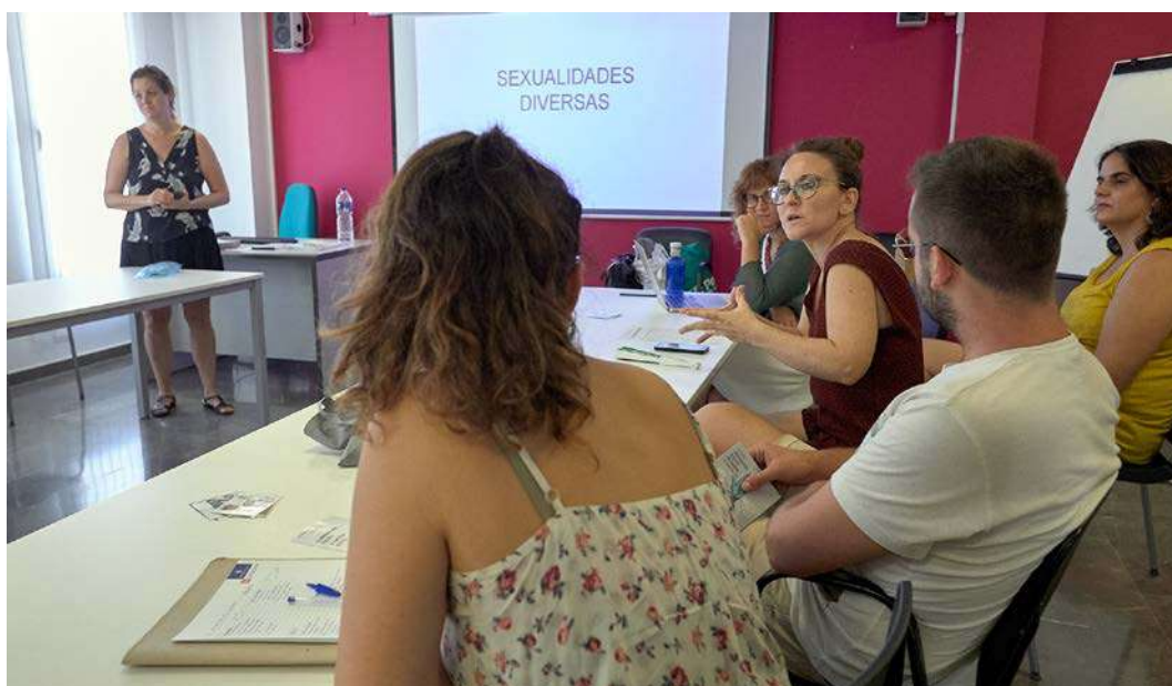
En un moment del taller Sexualitats diverses

El taller, "Sexualitats diverses, realitats sobre les persones LGTBI amb discapacitat intel·lectual", va tindre una duració de 5 hores, i es va impartir el 16 de juliol, de 9:30 a 14:00 al Centre Internacional de Gandia.