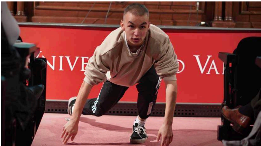
Performance Lázaro , de Roberto Hoyo

La jornada es va iniciar amb la performance Lázaro , de Roberto Hoyo, premi del jurat de la tercera edició de Russafa Escènica per la innovació en el llenguatge escènic i el contrast de text clàssics i actuals. Es tracta d'una adaptació rap del Lazarillo de Tormes i un exemple més de la diversitat que connecta amb el públic més jove, tan absent a les sales de teatre.