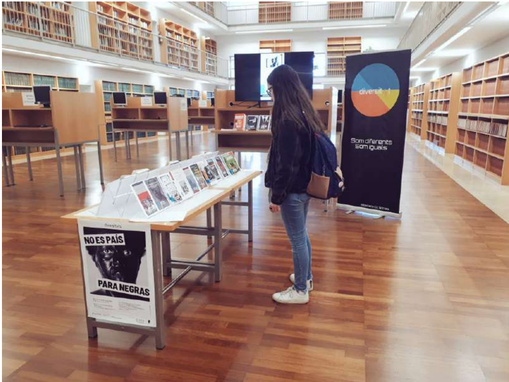
Una estudiant consulta els llibres del punt expositiu de la biblioteca