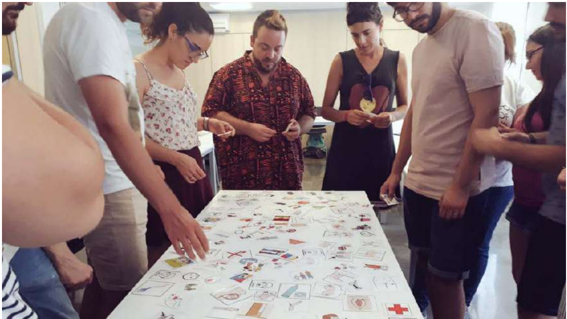
Una de les dinàmiques que es van realitzar al taller

El taller pretenia mostrar la diversitat i singularitat de la sexualitat humana des d'una perspectiva de gènere i interseccional. A través d'una metodologia teòrica-pràctica, es van analitzar els mites i les realitats de les identitats no normatives, com és el cas de les persones LGTBI amb discapacitat intel·lectual que s'enfronten a "dobles armaris", i es donaren a conèixer els suports accessibles que es poden oferir per reconèixer el seu dret a gaudir d'una vida afectivosexual plena, saludable i diversa.