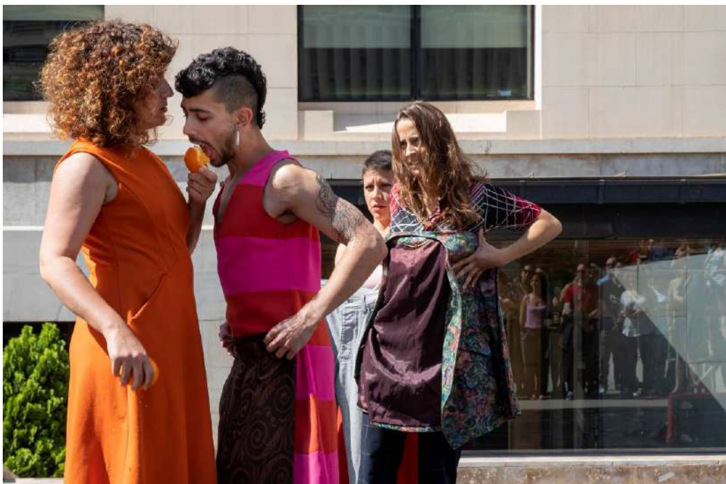
Un moment de la representació Lo inevitable