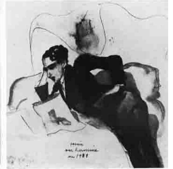
6. Portrait de Picasso, détendu, dans l'intimité, par Hermine, 1911.