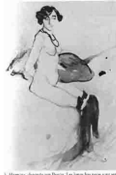
3. Hermine, dessinée par Picasso. Les longs hautes sont semblables à ceux que Picasso portera lui-même plus tard.