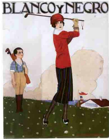
52. Salvador Dalí