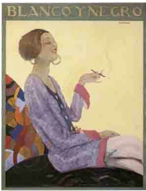
52. Salvador Dalí