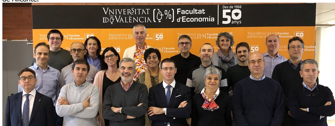
4 dic. Foto de grupo para la memoria de actividades de la FdE

Tamarit C. : "Las razones de Europa". XXXIV Jornadas de Alicante sobre Economía Española , 7 – 8 noviembre 2019, Universidad de Alicante.