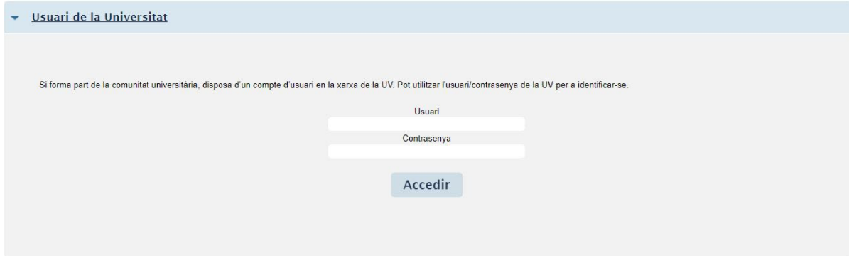
Il·lustració 1. Identificació d'usuari i contrasenya

Posteriorment, ha d'identificar-se en la pantalla (il·lustració 1), amb l'usuari i contrasenya de la Universitat de València.