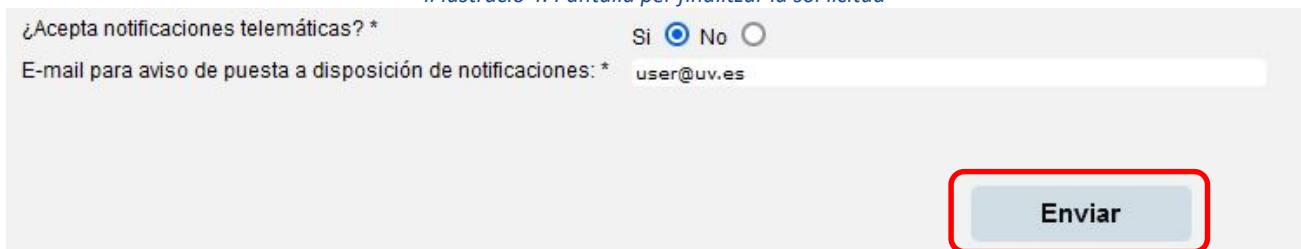
Il·lustració 4. Pantalla per finalitzar la sol·licitud

Finalment, en la pestanya "Finalitzar" haurà d'indicar-se que s'accepten notificacions telemàtiques i indicar el correu, a continuació, prémer l'opció Enviar .