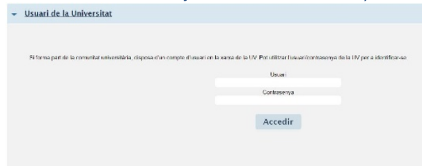
Il·lustració 1. Identificació d'usuari i contrasenya

Posteriorment, ha d'identificar-se en la pantalla (il·lustració 1), amb l'usuari i contrasenya de la Universitat de València.