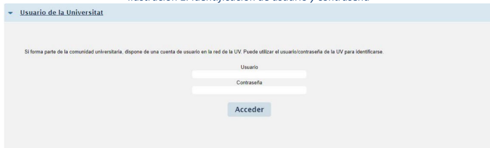
Ilustración 1. Identificación de usuario y contraseña

Posteriormente, debe identificarse en la pantalla (ilustración 1), con el usuario y contraseña de la Universitat de València.