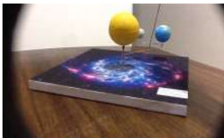
Il·lustración 1. Maqueta Eclipse