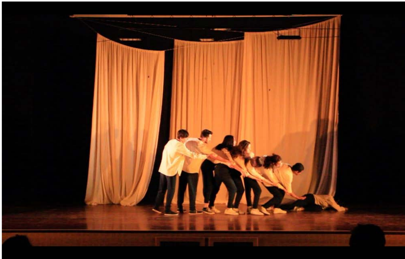
El príncipe marzo 2018 (Madrid, UFV)