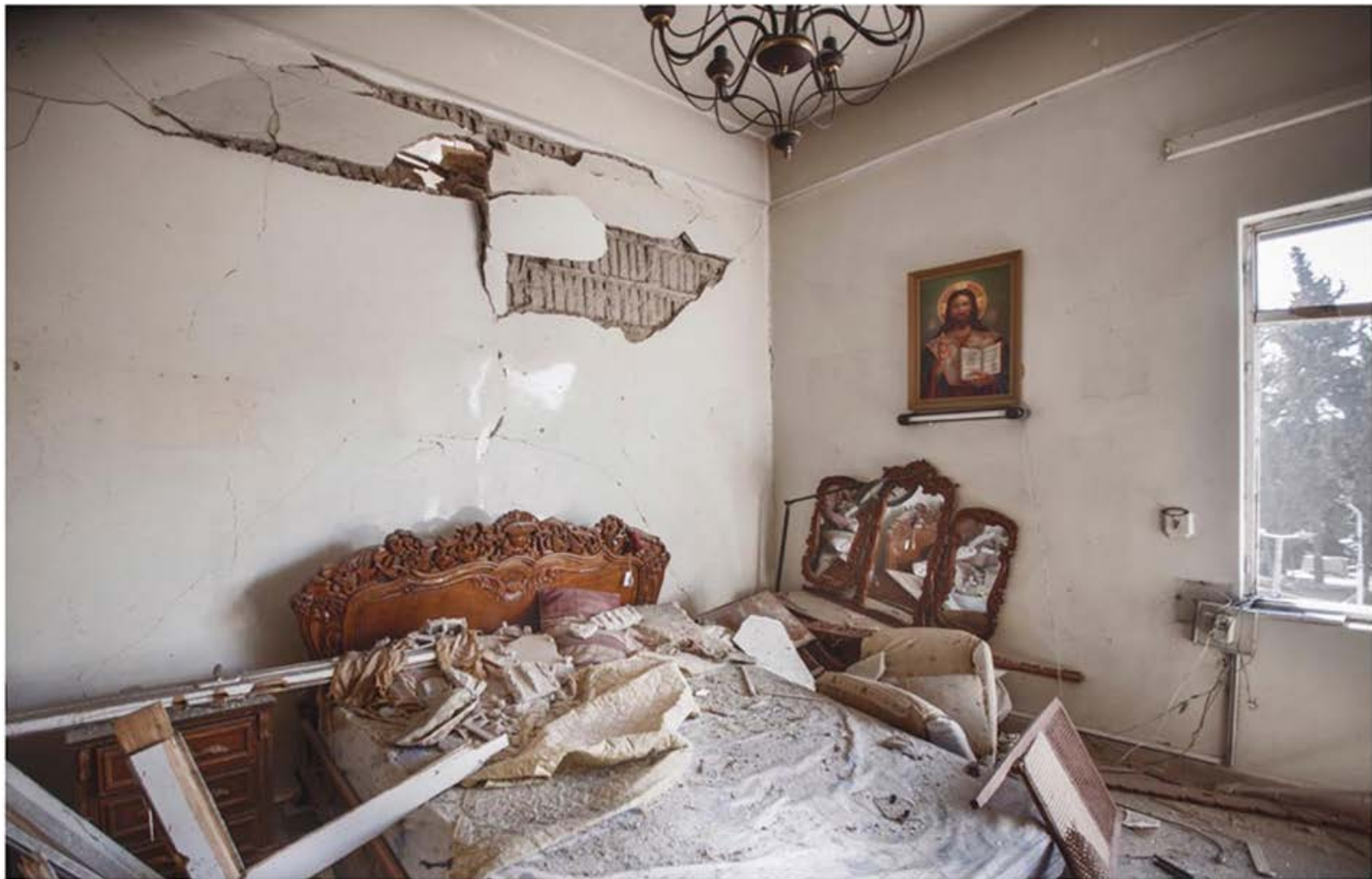
“Shuhuc. Testigos”, Carde Alfarah.