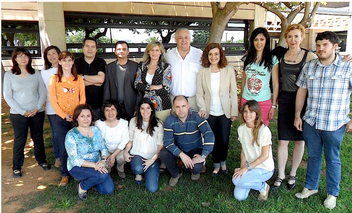
Miembros del Equipo del WHO CC

El Equipo está constituido por todos los investigadores adscritos a los tres Grupos de Investigación antedichos y bajo la batuta de los tres Investigadores Principales citados, incluyendo desde Doctores contratados, Becarios posdoctorales y predoctorales, y tanto españoles como extranjeros.