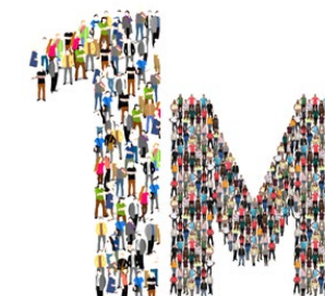
Dia Internacional Del Treball

Amb tot, convé recordar que la història ens demostra que els drets es defensen, si no volem perdre'ls.