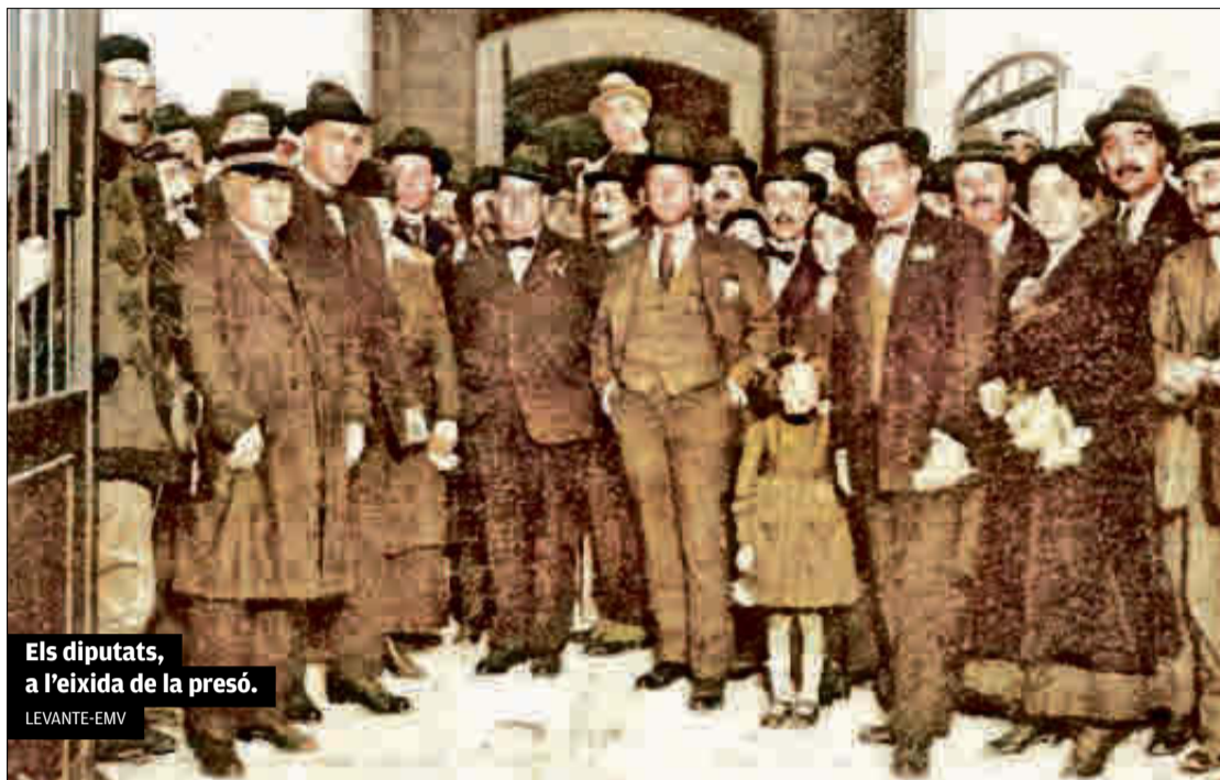
Els diputats, a l'eixida de la presó.