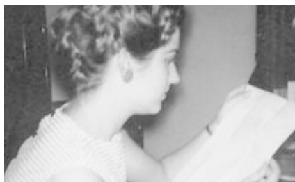
Valencians, exiliats i reconeguts a l'estranger