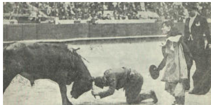
Els "Muixeranguers" i l' escola de "Llapissera"