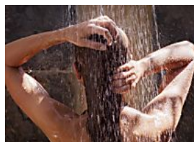
Diez errores que cometes al ducharte