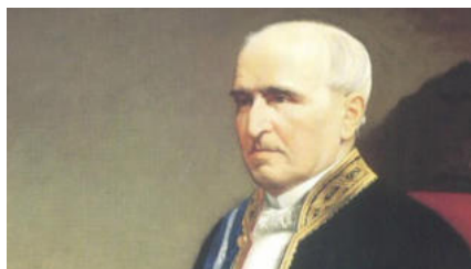
El govern, a favor d'una vídua de Patraix