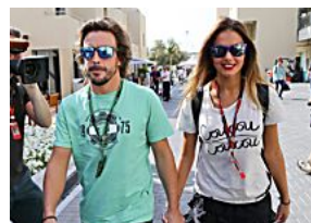
Fernando Alonso reacciona a su supuesta ruptura con Lara Álvarez