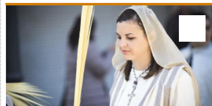
Procesión de Domingo de Ramos en Valencia