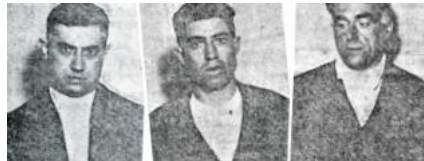
Un lladre, cantiner de la Guàrdia Civil

FRANCESC J. HERNÁNDEZ A València s'han perpetrat alguns robatoris amb una certa audàcia. És el cas de l'atracament realitzat el 9 de març del 1992 a la sucursal del Banc Exterior, a la cruïlla dels carrers Pintor Sorolla i Poeta Querol, per al qual els assaltants aprofitaren el rebombori d'una de les mascletades falleres per dissimular que entraven al banc, segrestaven set persones i fugien sense deixar rastre amb cent milions de pessetes de botí. Pitjor sort tingueren els lladres que el 17 d'abril de 1871 intentaren robar la delegació del Banc d'Espanya a València, que en aquella època es trobava a la banda de llevant de la plaça de la Congregació, ara, de Sant Vicent Ferrer, junt al carrer del Mar. Els lladres havien llogat una casa al número 11 de l'antiga plaça de les Barques (que ara és l'eixamplament del carrer Pintor Sorolla, prop de la cruïlla amb el carrer Universitat), des de la qual feren un túnel fins al «vall cobert», les restes de l'antic fossat de la muralla àrab que antigament foren tapades i integrades a la xarxa del clavegueram urbà. El vall cobert passa per baix dels carrers Universitat i Comèdies i arriba a la plaça de Sant Vicent Ferrer, on es trobava el banc.