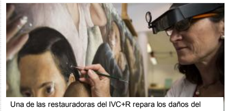
Una de las restauradoras del IVC+R repara los daños del

Contenido exclusivo para suscriptores digitales