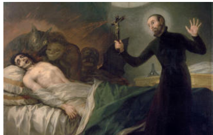
Aparicions i possessions diabòliques a la València del XVI

Possessions diabòliques. A la València de la Contrareforma hi hagueren testimonis d'aparicions diabòliques perseguides per la Inquisició. Solien esdevenir a dones i foren matèria de debat teològic.