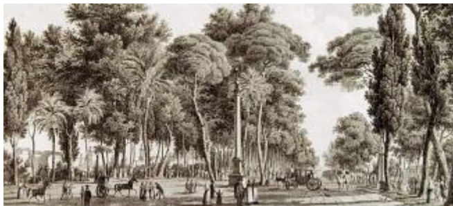
L'excomunió del superintendent