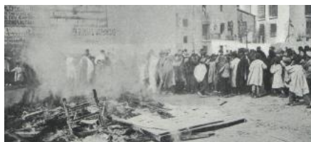
Els consumers i els matuters dels fielats