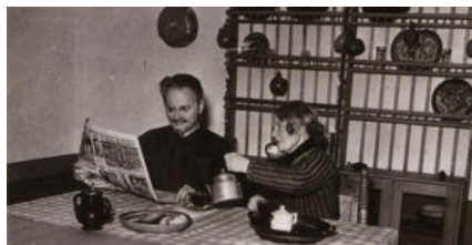
Una filla d'Azzati i l'assassinat de Trotski