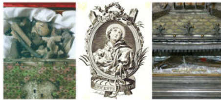
Els braços de Sant Vicent

"Totes i cadascuna de les relíquies són vertaderes, perfectes i indubitable", va a afirmar el papa valencià Calixt III en una butlla del 1457, sobre les donades per ell a la catedral valenciana. Però ara, cinc segles i mig després, moltes semblen frauds.