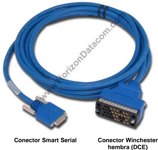
Cable serie DCE de router 1720

En la figura siguiente se muestran los cables serie que se utilizarán en esta práctica. La interfaz V.35 utiliza un conector rectangular denominado Winchester. Algunos cables utilizados tendrán conector hembra (DCE, Data Communications Equipment), mientras que otros tendrán conector macho (DTE, Data Terminal Equipment) y otros conector hembra (DCE).