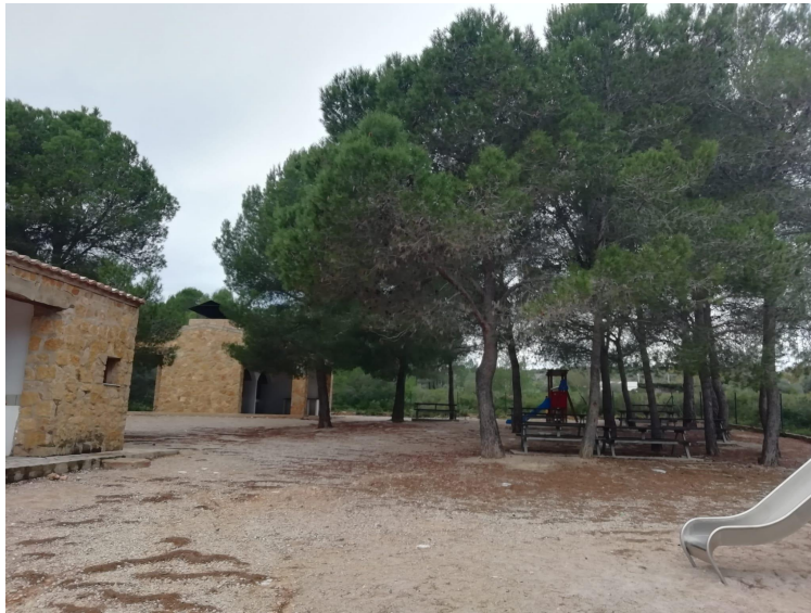
Figura 1. Paratge natural el Bovalar, berenadors on dinaran els alumnes