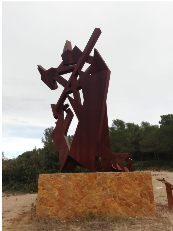
Figura 2. Escultura de sant Jordi de l'artista local José Luis Ferreres "Ferr"