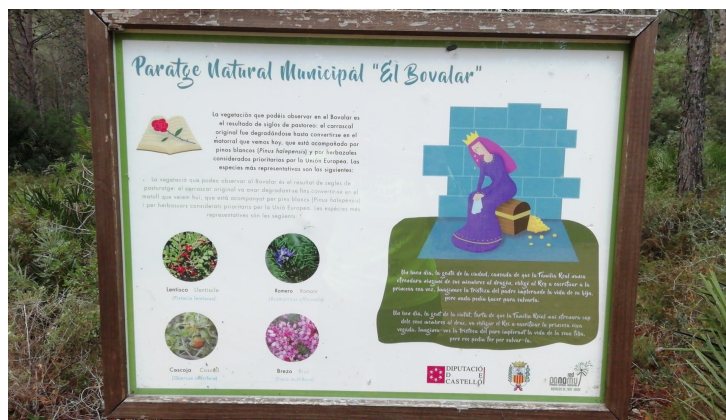
Figures 3, 4 i 5. Panells de la gimcana de sant Jordi