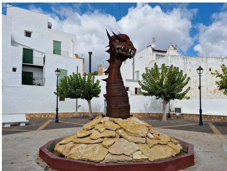
Figura 6. Escultura de l'artista local José Luis Ferreres "Ferr", situada a la Plaça Espanya