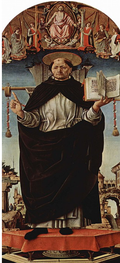
ANNEX 1. Pintura de sant Vicent Ferrer, per Francesco del Cossa, un important pintor italià del Quattrocento adscrit a l'escuela de Ferrara.