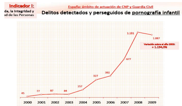
Figura 2. Evolución Delitos detectados y perseguidos de pornografía infantil.

Entre enero y septiembre de 2010 se detectaron mediante un software policial más de 400.000 archivos susceptibles de contener pornografía infantil.