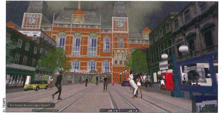
Ciutat d'Amsterdam a SecondLife.

En aquest sentit, la qüestió principal que cal resoldre és: quin formalisme és el més adient per a la representació semàntica de la informació en els mons virtuals 3D? Pensem que la resposta adequada es troba en l'accepció informàtica de la paraula ontologia . En la filosofia grega, aquest terme corresponia a l'estudi de l'ésser i tenia per objectiu descriure o posar