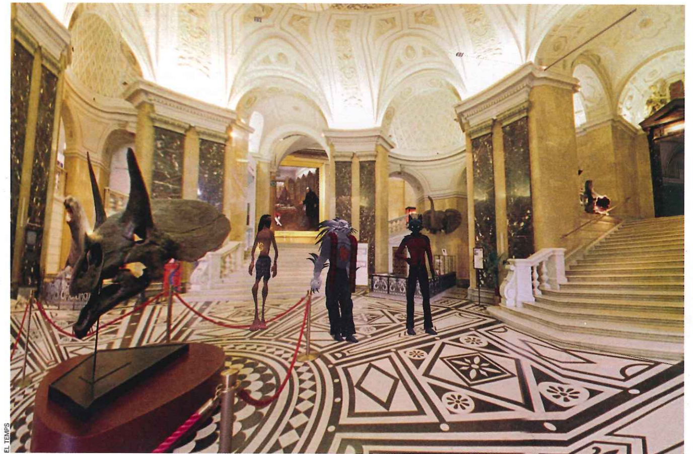
EL MUSEU D'HISTÒRIA NATURAL DE VIENA, REPRESENTAT EN EL MÓN VIRTUAL DE SECOND LIFE.

Un aspecte a què s'enfronten molts d'aquests mons és al repte d'habitar l'entorn amb criatures virtuals autònoms, ço és, no controlades per cap usuari humà. Aquests éssers no sols hauran de mostrar una bona qualitat gràfica, sinó també una mena de credibilitat de comportament. L'animació de comportament de personatges 3D té per objectiu la construcció de sistemes intel·ligents capaços d'integrar diverses tècniques a fi d'aconseguir la simulació versemblant dels comportaments. Hi podem incloure la percepció, el control motor, la selecció d'objectius, l'execució d'accions, la comunicació entre els agents, etc. Aquesta necessitat ha promogut la inclusió de tècniques