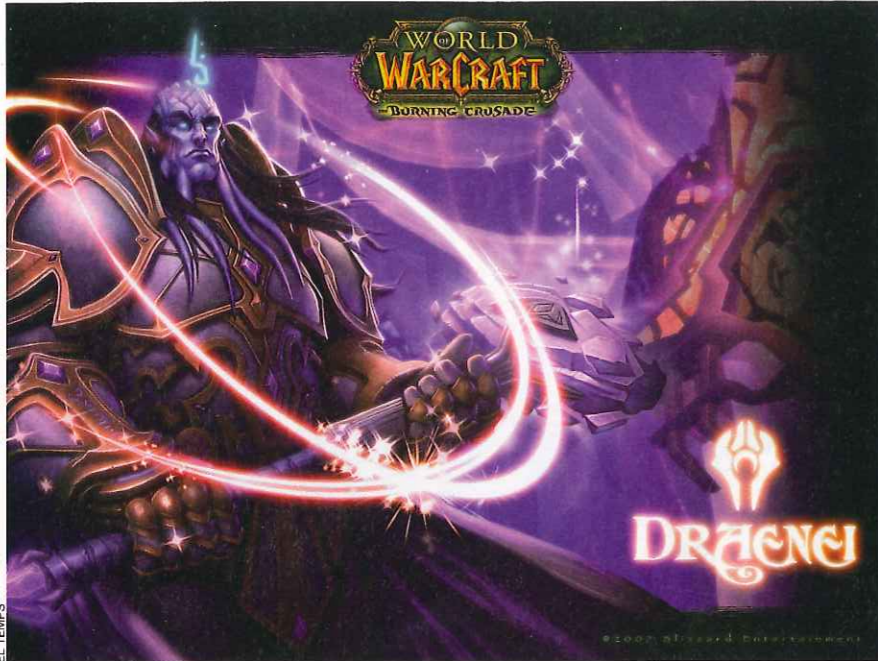
World of Warcraft és un exemple de videojoc en línia. El jugador hi adopta el paper d'un personatge en un ambient fantàstic.