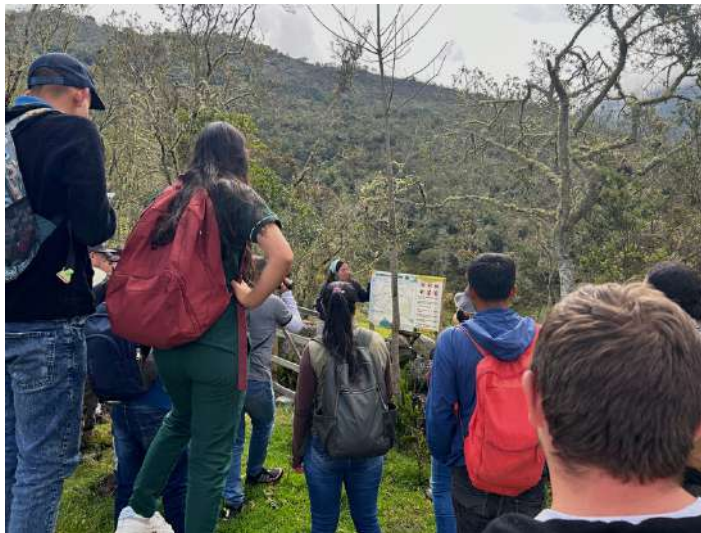
Voluntaris i voluntàries en el parc natural.