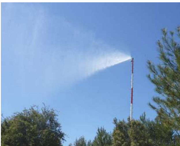
Parte de la infraestructura antiincendios realizada | Valencia Plaza.

Este gran proyecto se ha llevado a cabo, principalmente,