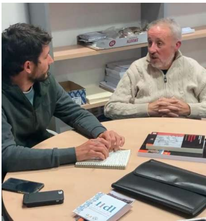
L'alcalde de Vall de la Gallinera i el director de l'IIDL durant la reunió.