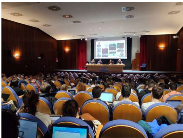
La mesa de debate durante la jornada.