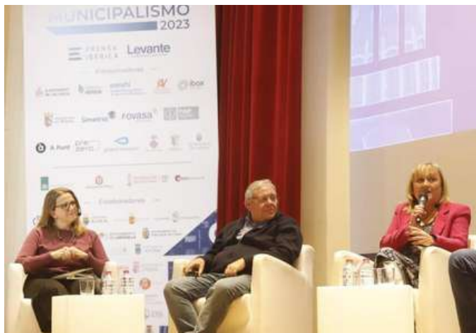
Imatge del debat