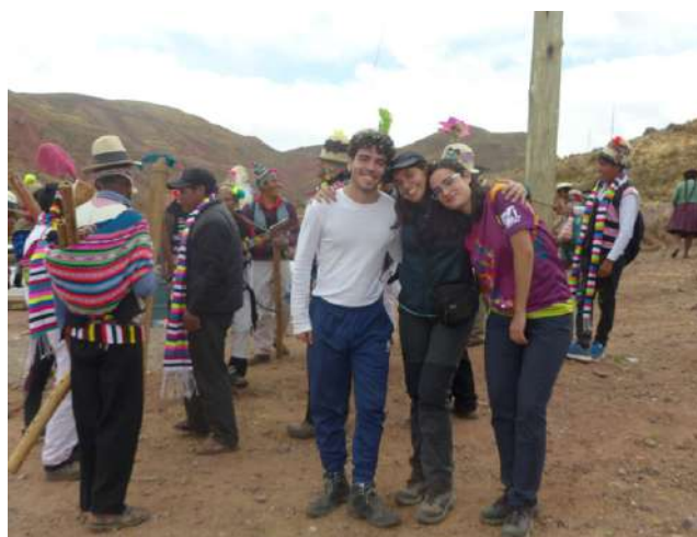
Estudiants del MCAD durant les pràctiques en l'ONG Institut Politècnic Tomás Katari de Bolívia.

En febrer va començar una nova etapa per als i les estudiants del MCAD. Fins a juliol estaran aprenent i especialitzant-se en un dels dos itineraris que ofereix el títol: "Planificació integral del desenvolupament local" i "Salut en països en desenvolupament". El primer itinerari ofereix formació en: Principis i teories per a la planificació i la gestió del desenvolupament territorial; Mètodes, tècniques i instruments per a la planificació i la gestió del desenvolupament; i Xarxes socials i iniciatives emprenedores. En el segon s'imparteixen les matèries: Salut pública; Malalties als països en desenvolupament, i Polítiques i gestió sanitària en països en desenvolupament.