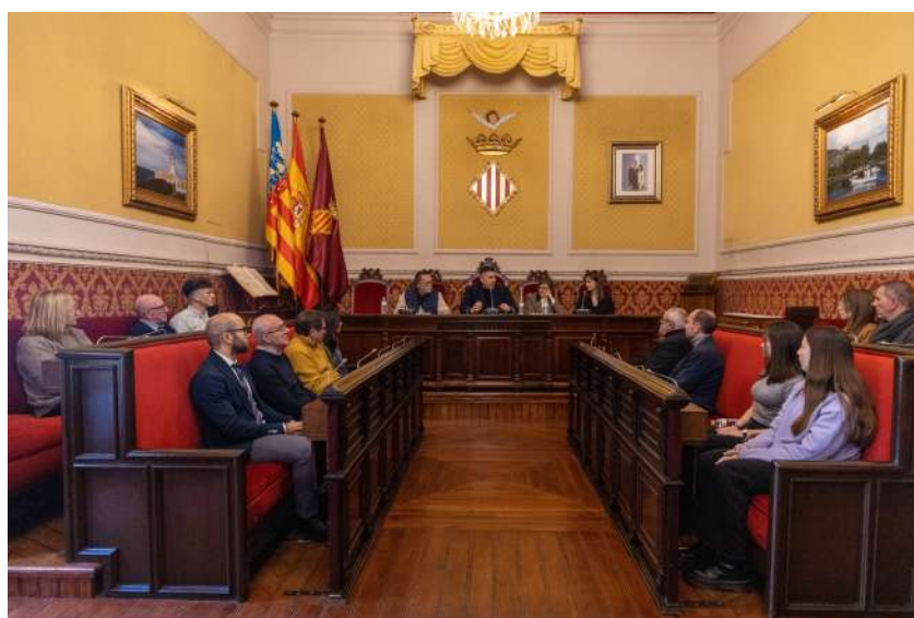
La sala durant l'entrega del premi.

El premi d'iniciació a la investigació Joaquín Olivert té per objectiu ampliar el coneixement sobre Cullera i el seu territori incentivant als estudiants de grau, màster i doctorat perquè facen les seues investigacions (tesi doctoral, TFG i TFM) sobre aquest municipi. Aquest primer premi està dotat de 750 euros i la publicació física de la investigació, que ja forma part de la col·lecció Estudis i Documents de Desenvolupament Local (número 40), coordinada des de l'IIDL per al servei de publicacions de la Universitat de València.