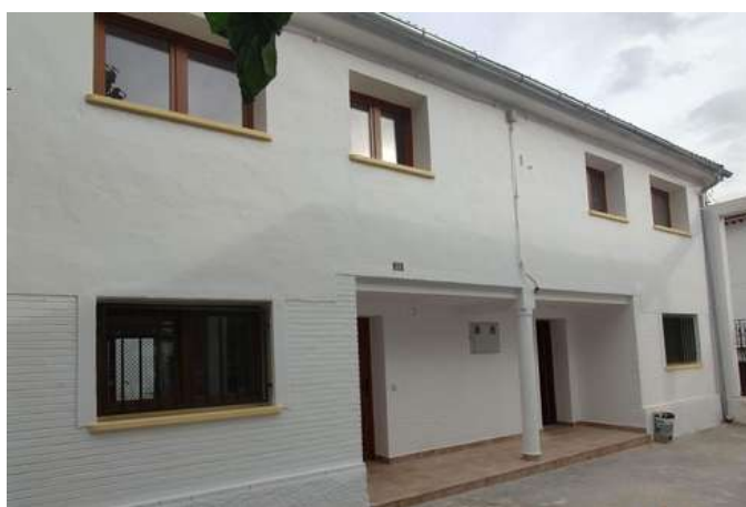
Vivendes rehabilitades per a coliving en Vall de la Gallinera.

La reunió va concloure amb l'acord de formalització de la col·laboració i el compromís per totes les parts de desenvolupar una memòria tècnica del projecte pilot per a poder oferir les pràctiques formatives el curs que ve.