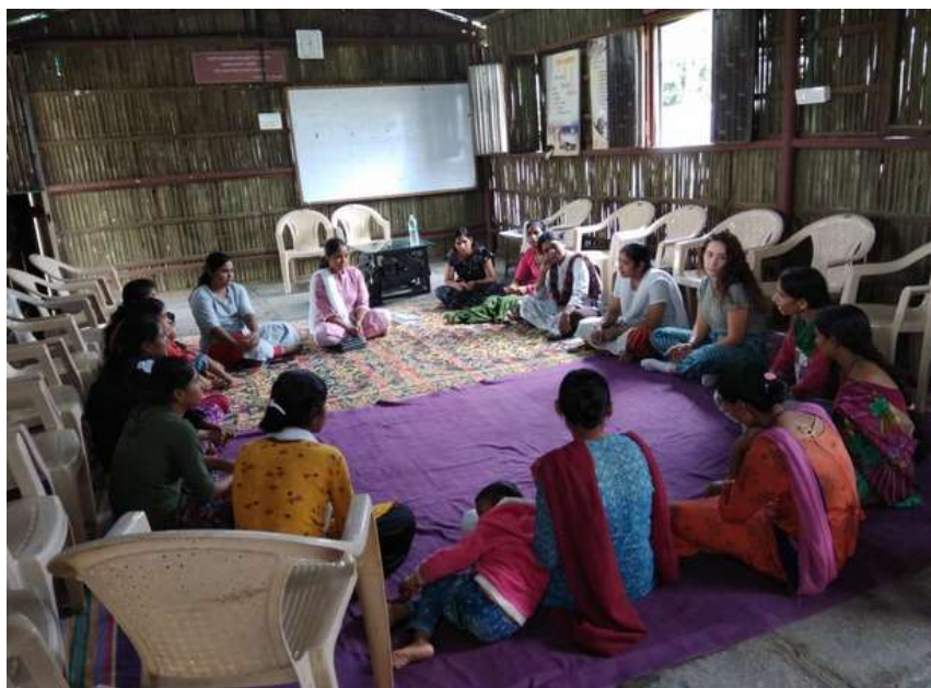
Reunió de l'Associació "Saheli Women" de l'Índia, on una alumna ha fet pràctiques.

Acaben el primer i segon període de pràctiques externes del Màster en Cooperació al Desenvolupament (MCAD), durant els quals els i les alumnes del segon curs del màster van desenvolupar les seues pràctiques externes curriculars en les dues modalitats disponibles, professional i investigadora.