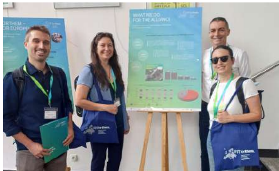
Miembros del IIDL representando a FITFORTHEM-UV en Opole.

A lo largo de esta jornada, cada universidad asociada presentó lo realizado en el área que coordina durante y compartió algunas de las prácticas organizativas transformadoras e innovaciones que FITFORTHEM ha impulsado. Se discutió en detalle los retos en ámbitos como la ciencia abierta y la cocreación, el capital humano y los recursos de investigación, o las formas de hacer accesible el patrimonio cultural. También intervino el Consejo Asesor Externo para debatir las alineaciones y sinergias con el (futuro) proyecto FORTHEM.