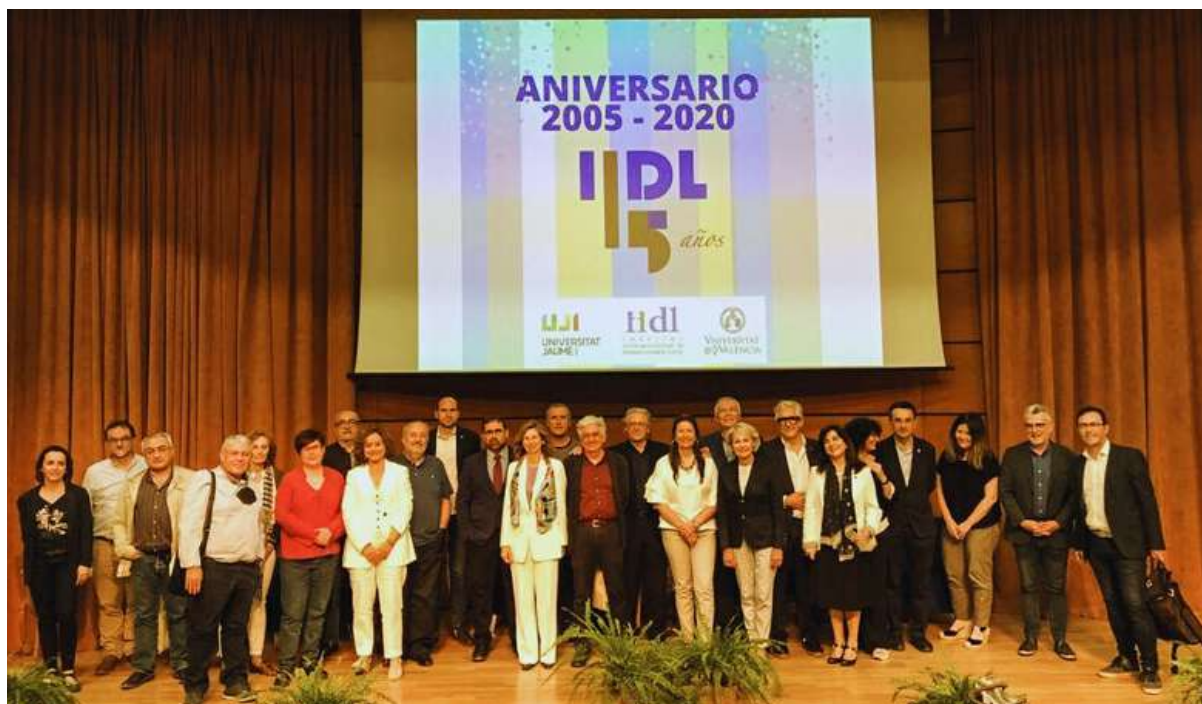
Miembros del IIDL de los centros de Valencia y de Castellón, tras el cierre de la mesa redonda