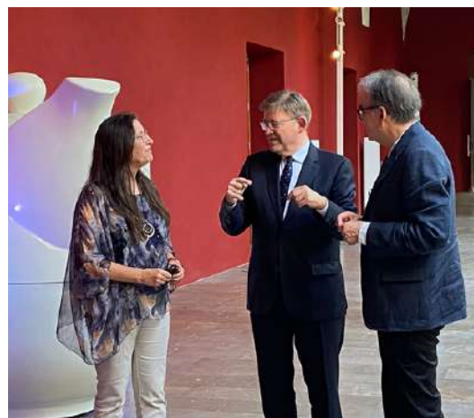
A dalt, la directora de la Càtedra presentant la jornada. A baix, la directora amb Joan Subirats, Ministre d'Universitats i Ximo Puig, President de la GVA.