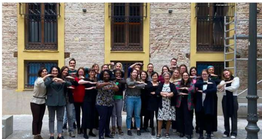
Miembros de la Asamblea General de EQUALS-EU.

La asamblea general de proyecto EQUALS-EU, realizada recientemente en Valencia con la participación de los más de treinta socios internacionales, entre los que se encuentra el equipo de la UV conformado por miembros del IIDL, ha seguido un intenso programa de actividades para debatir sobre los avances del proyecto y preparar las acciones de futuro.