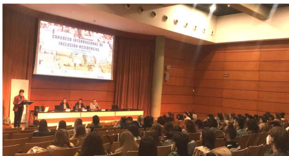
La rectora de la UV durante la inauguración del evento, que contó con gran asistencia.

En el evento, organizado por el IIDL, colaboraron la Vicepresidència i Conselleria de Igualtat i Polítiques Inclusives, la Conselleria d'Innovació, Universitats, Ciència i Societat Digital, el Departamento de Trabajo Social y Servicios Sociales, la Facultat de Ciències Socials, la Diputació provincial de Valencia y la Càtedra Luis Amigó.