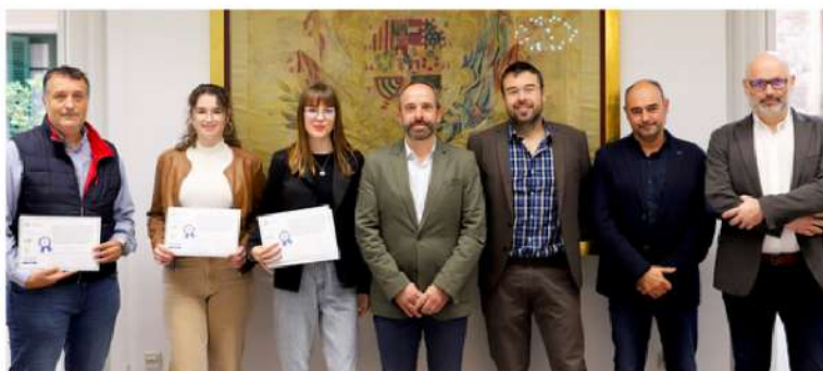
Les premiades amb el seu professor i els promotors del premi.

El projecte "Edunature Cooperativa Social i d'Educació i de Medi ambient" ha aconseguit el premi a la millor idea d'emprenedoria innovadora en municipis en risc de despoblament, en la convocatòria llançada per l'Institut Interuniversitari de Desenvolupament Local (IIDL-UV) i la Diputació de València per a premiar la millor proposta per part d'estudiants d'Educació Secundària Obligatòria (ESO), batxillerat i/o cicles formatius de la