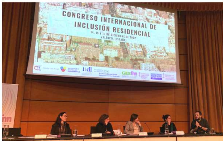
La mesa sobre recuentos nocturnos durante la exposición.

La falta de hogar atenta contra los derechos humanos y constituye uno de los retos y desafíos más importantes del siglo XXI para la agenda política de los gobiernos locales, autonómicos y estatales. Este fue el concepto a partir del cual el grupo de investigación GESinn del IIDL organizó el I Congreso Internacional de Inclusión Residencial, celebrado el pasado 15 de diciembre en el Jardí Botànic de la UV, para debatir sobre el reto que supone apostar por políticas integrales que velen por los derechos de ciudadanía en relación a la inclusión residencial urbana.