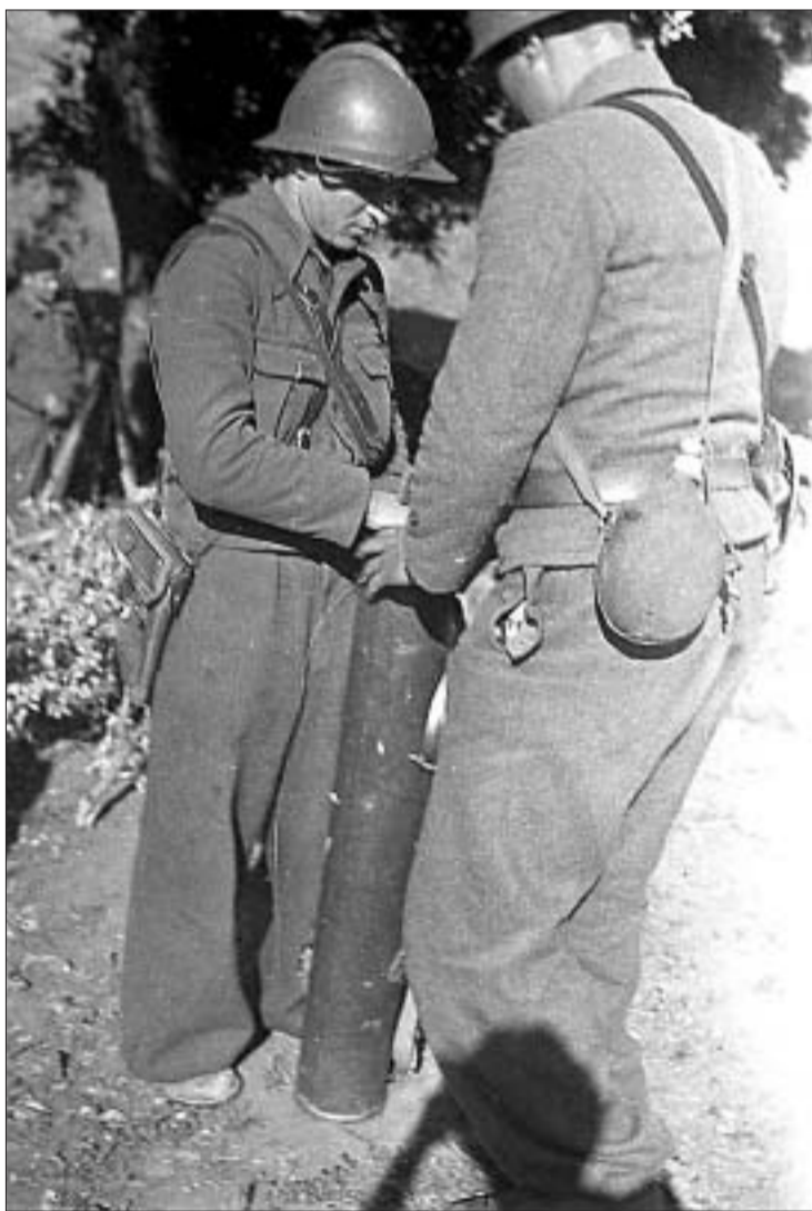
GERDA TARO © INTERNATIONAL CENTER OF PHOTOGRAPHY

Manuel Azaña homenajeando a Federico García Lorca. Conservadores de la George Eastman House de Rochester trabajan en la preservación de los negativos; Cynthia Young y Kristen Lubben están al frente del proyecto de digitalización de las fotografías, que se lleva a cabo en el ICP (Manhattan). El objetivo de dicha institución es dar a conocer este año las imágenes y ponerlas a disposición de los investigadores mediante la publicación de un catálogo digital de acceso a través de internet.