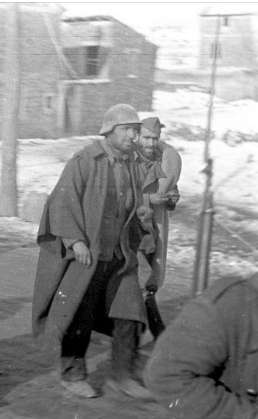
ROBERT CAPA © MAGNUM PHOTOS

[El presente texto ha sido concebido en el marco del proyecto de investigación I+D titulado «Función de la imagen mecánica en la memoria de la guerra civil española» [HUM2005-02010/ARTE], del Ministerio de Educación y Ciencia]