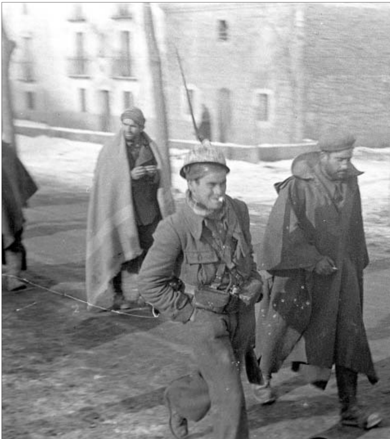
TERUEL. Frente de Aragón en enero de 1938.