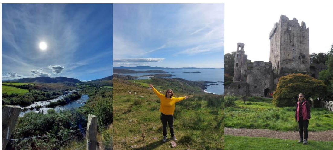
Imatges 2 i 3: Cliffs of Moher. Imatge 4: Ring of Kerry. Imatge 5: Ring of Kerry (Gap of Dunloe). Imatge 6: Blarney Castle.