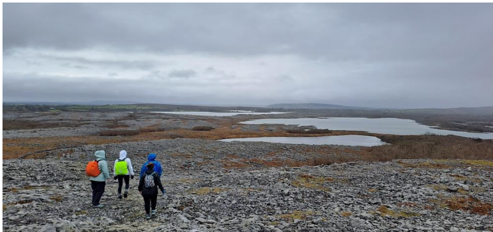
Imatge 10: The Burren

És cert allò que diuen sobre el seu clima: "Irlanda té les quatre estacions de l'any cada dia!".