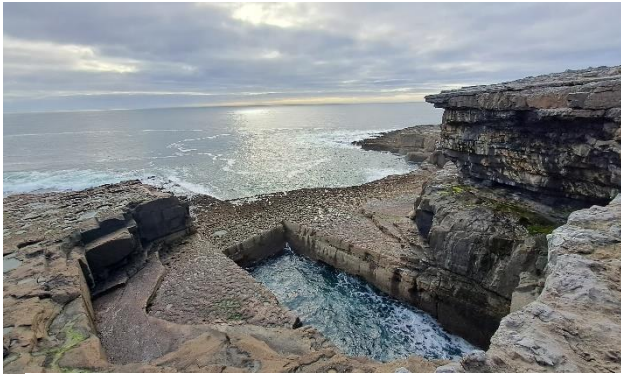
Imatge 9: Aran Islands