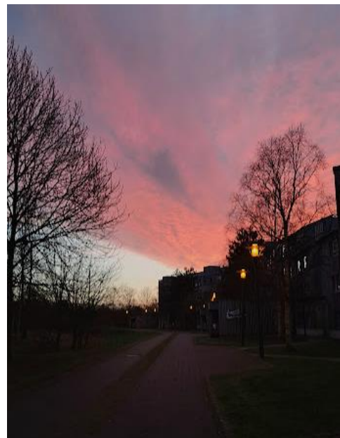
Imatge 1: El meu carrer a Thomond Village

Aquest tipus d'amistats van ajudar a assimilar Limerick com la meua casa durant aquell temps, ja que quan els estudiants arribem, no coneixem a ningú i no és una ciutat massa extraordinària. És graciós pensar la quantitat de gent que ens trobem en la mateixa situació durant eixos dies i com ens anem ajuntant entre tots i totes. Cal fer una menció important al gran treball que fa l'oficina internacional de la UL per acollir-nos i ajudar-nos. Abans de començar el curs, organitzen una setmana d'orientació per a tot l'alumnat Incoming per tal d'explicar tot allò que necessitem saber i per empenyar-nos a relacionar-nos i conèixer el campus. Inclús durant el quadrimestre segueixen publicant articles interessants a la seua web i xarxes socials ( https://www.ul.ie/global/incoming-students , https://www.instagram.com/ulglobal/ ), organitzant esdeveniments i atenent-nos en la seua oficina amb els braços ben oberts.