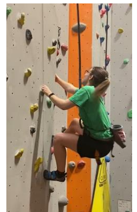
Imatge 11: Rocòdrom de la universitat, el més alt d'Irlanda

En definitiva, ha sigut un any en el que m'he desenvolupat en tots els sentits i conforme passa el temps, me n'adone de més detalls. Tant de bo tothom tinguera aquesta oportunitat!