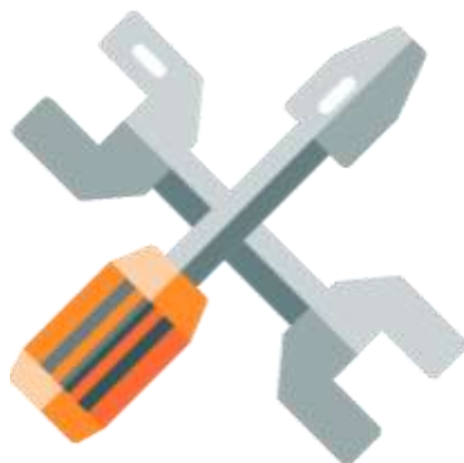
Eines per a l'avaluació

Con enlaces a los criterios de los diferentes campos