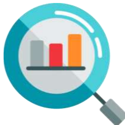
Indicadors per a l'avaluació

También a algunas guías para saber utilizar dichas herramientas.