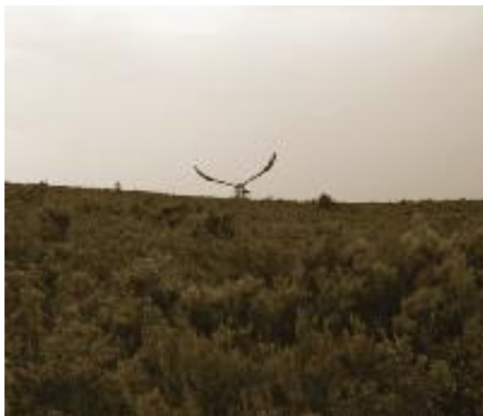
Ejemplar adulto de aguilucho cenizo marcado con emisor satelital sobrevolando el área de nidificación.