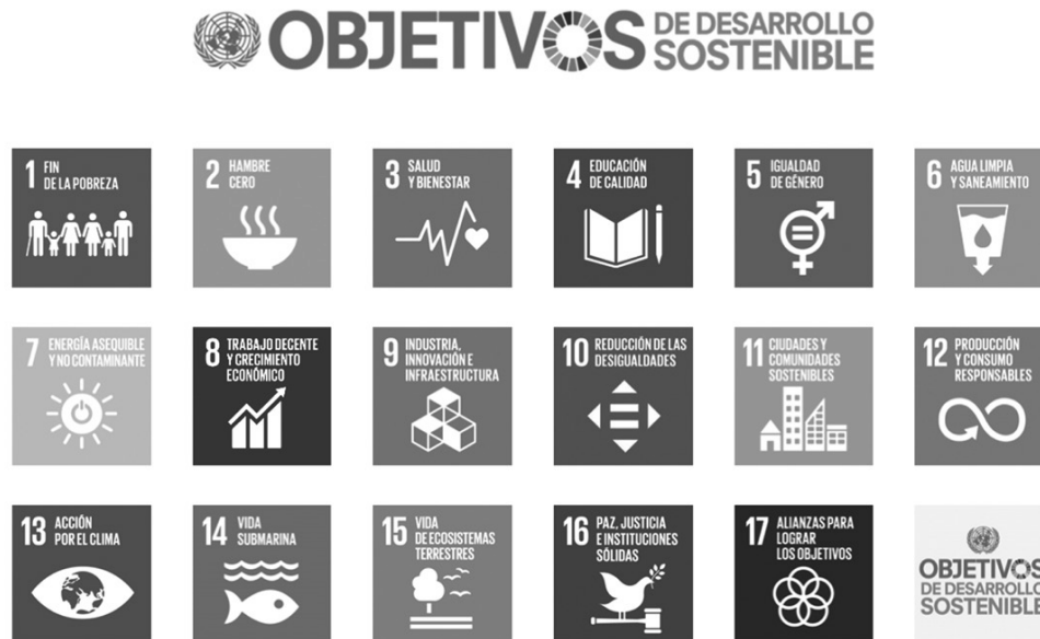
Figura 1. Objetivos de Desarrollo Sostenible de Naciones Unidas 2015