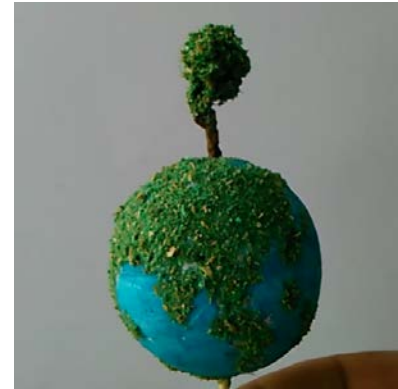
Resultat final de la maqueta de la Terra

Realitza frases que inspiren la protecció del nostre planeta Terra (aquestes frases es retallaran i es clavaran sota l'escuradents que subjecta la Terra i seran publicades en la nostra web i xarxes socials