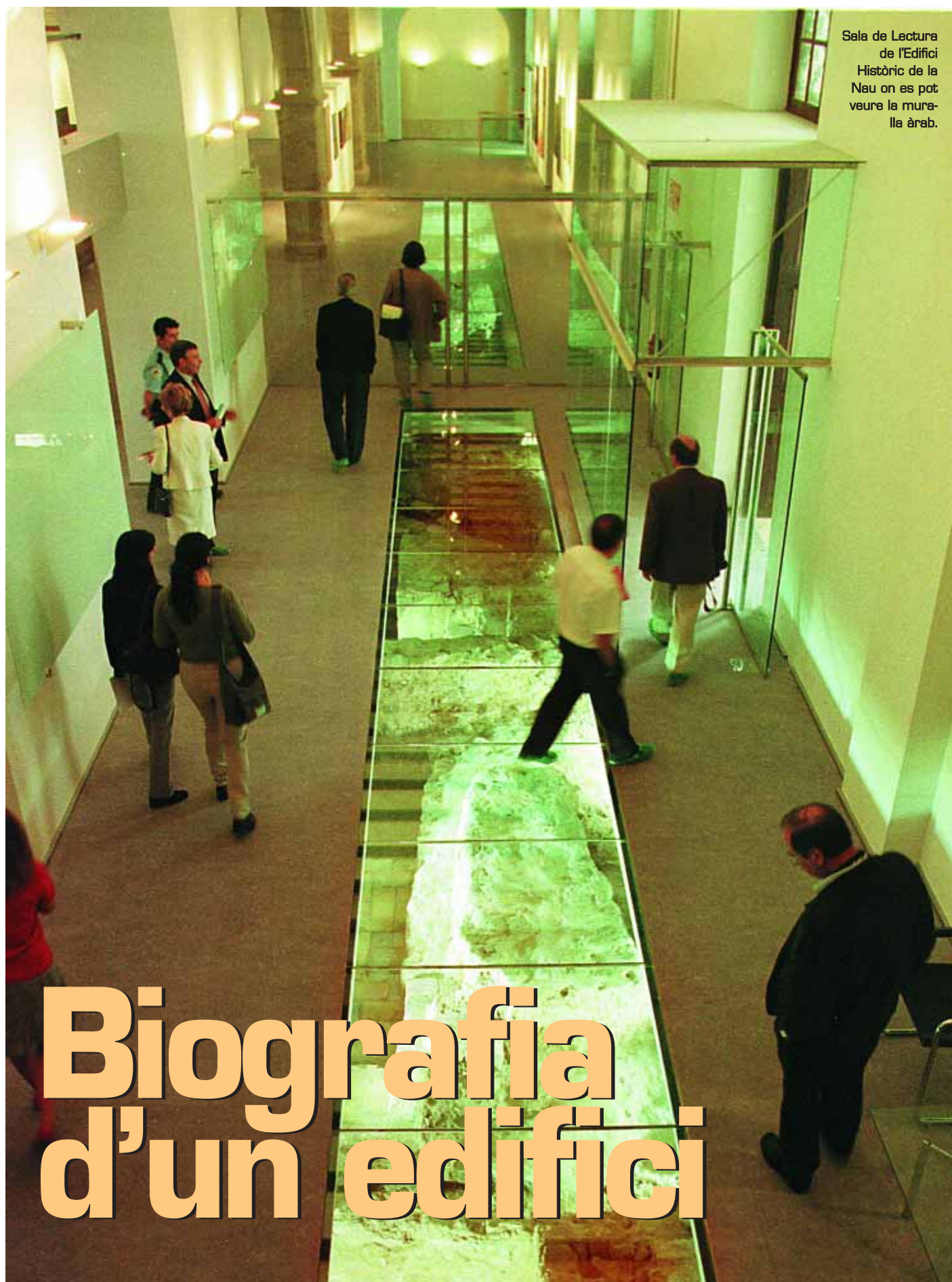
Sala de Lectura de l'Edifici Històric de la Nau on es pot veure la muralla àrab.