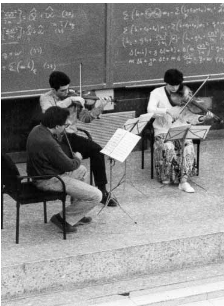
Actuació en una Festa de Benvinguda d'un curs anterior.

Els nous universitaris podran recollir l'agenda, fins al 15 d'octubre, en les tres oficines del Servei d'Informació a l'Estudiant-DISE dels campus de la Universitat de València.