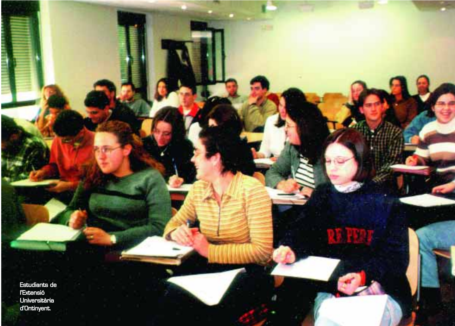
Estudiants de l'Extensió Universitària d'Ontinyent.