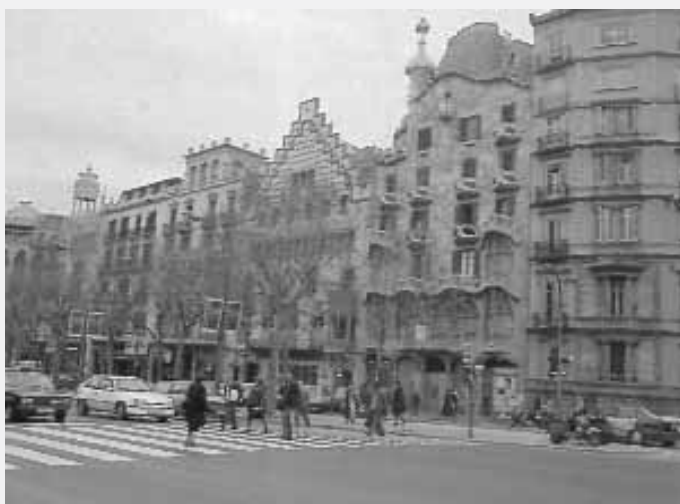
Passeig de Gràcia a Barcelona.

Barcelona és una ciutat de la Mediterrània que guarda amb nosaltres uns vincles afectius estretíssims. Hi ha moltes maneres de conèixer-la, si encara no la coneixeu, i si ja la coneixeu un poc de segur que encara us hi queda molt. Qualsevol època de l'any i amb qualsevol excusa és bona per anar-hi. Com tota gran ciutat, té una quantitat inesgotable d'atractius. Barcelona és rica en museus, per exemple. Apunteu en la vostra agenda, com a visites obligades, el MACBA, el Museu Picasso, la Fundació Miró. Però la ciutat sencera, amb la seua arquitectura plagada d'edificis modernistes, de places i de fonts, ofereix al visitant una excel·lent mostra d'art públic pel qual no s'ha de pagar cap entrada sinó que solament exigeix la vostra atenció per a gaudir-lo. L'empremta de Gaudí està esculpida en cada carrer de la ciutat, on, quan us heu avesat a veure tants edificis que porten la seua marca inconfusible, siguen o no d'ell, ja heu descobert i atrapat una de les visions inesborrables que us quedaran de Barcelona. Ara pot ser molt interessant anar a visitar el Liceu, que s'ha reconstruït després de l'incendi que l'assolà fa uns anys. L'obra és un exemple del compromís pel patrimoni cultural que caracteritza tots els seus veïns.