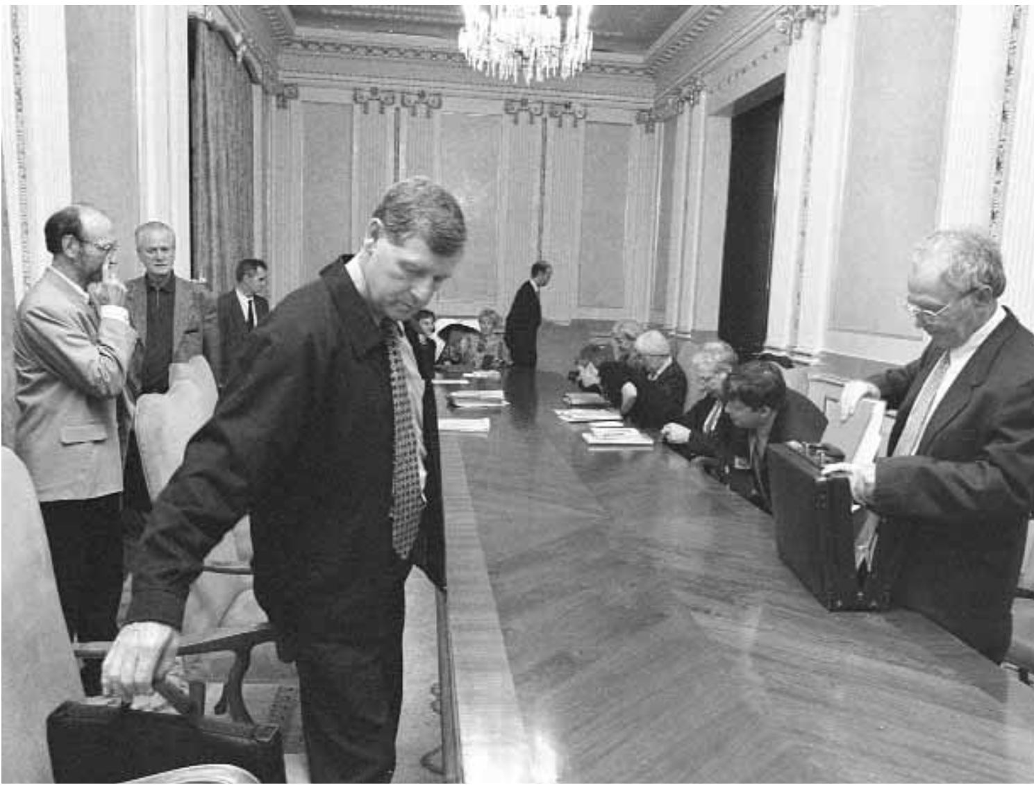
Secretaris d'universitats, aquesta setmana a València, durant una reunió prèvia a la visita dels rectors europeus.