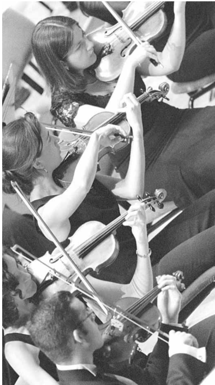
Músics de l'Orquestra Filharmònica de la Universitat.

Com a representants del segle XVII s'han seleccionat dos compositors que foren figures indiscutibles de l'època: Comes i Cabanilles. Les obres de Comes es podran escoltar de nou a València després de tres segles de silenci. El seu caràcter policoral il·lustra una de les característiques més innovadores de Comes. La segona part del concert s'inicia amb una peça pertanyent a un dels períodes més ignorats de la música valenciana: la primera meitat del segle XIX. Es tracta de l'obertura d'una de les òperes més conegudes de José Melchor Gomis, probablement l'autor valencià més popu-