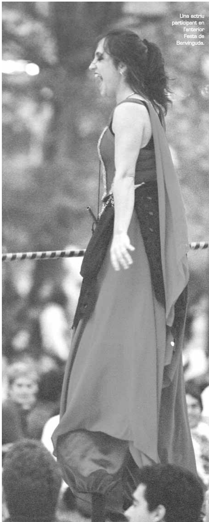
Una actriu participant en l'anterior Festa de Benvinguda.

IMATGEMÓN Recursos audiovisuals. Espai per al visionat de vídeos.