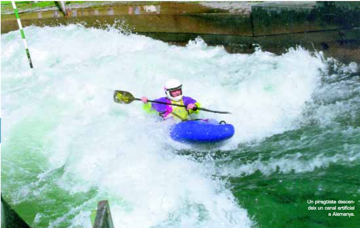
Un piragüista descendeix un canal artificial a Alemanya.

La Universitat oferta esports minoritaris d'alt interés