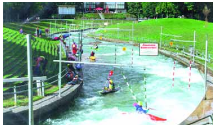
Circuit de piragüisme d'una universitat europea.

La navegació en canoa es practica des de temps immemorials. Els esquimals construïen aquestes embarcacions amb ossos d'a-