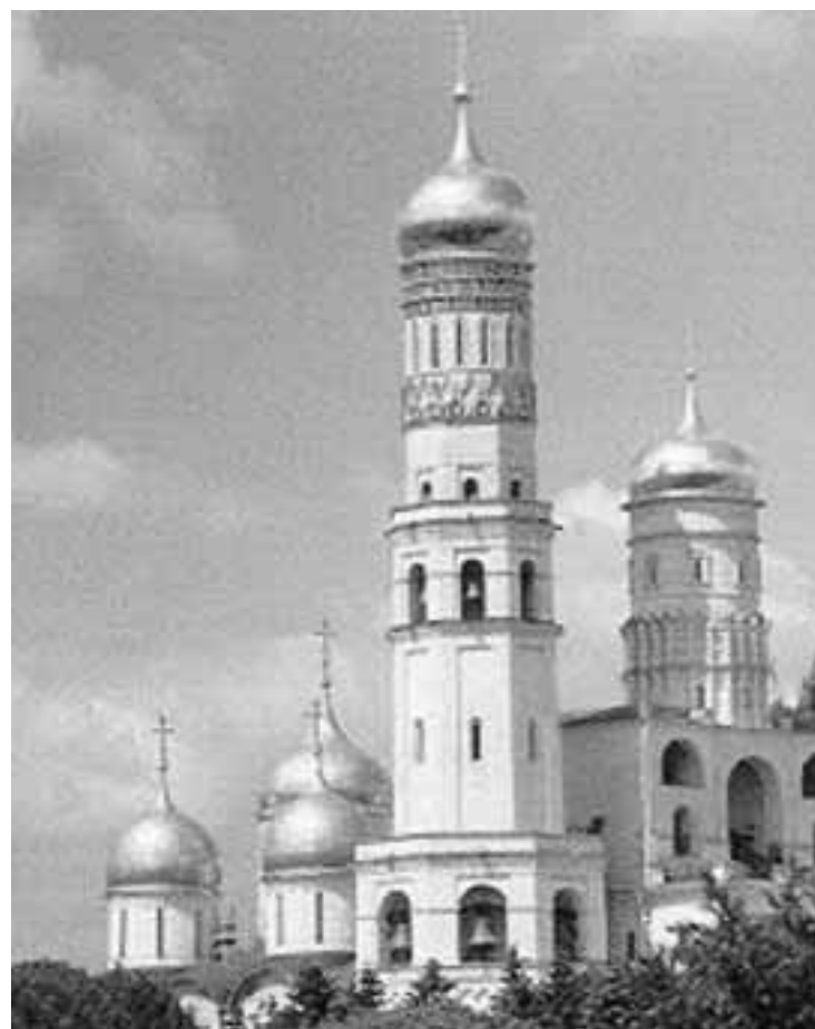
Església ortodoxa a Moscou.

Encara puc afegir alguna anècdota de collita pròpia: el 1976 els socials (que era com se solia anomenar els membres de la branca política de la policia franquista) van anar a buscar un amic meu a la fàbrica on treballava durant les vacances d'estiu i, ja a comissaria, entre altres amenitats, li van ensenyar la foto d'un de nosaltres per tal que el reconeguera. Segons vam deduir pels detalls que ens va contar després, la imatge només l'havien poguda obtenir a distància, amb un teleobjectiu, mentre parlava en una assemblea davant l'institut de les xiques, quan el personatge no havia complert encara els setze anys (l'interessat llig amb passió les notícies sobre el destí final de la documentació de la Brigada Político-Social, més que res perquè hi apareixia retratat