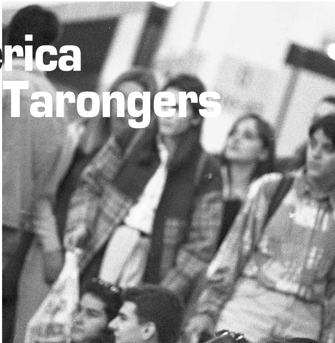
Els participants analitzaran les fórmules de cooperació entre les universitats d'Iberoamèrica.

Entre els destacats assistents a aquest congrés que se celebra entre el 28 i el 30 d'octubre a la Facultat de Dret, hi haurà més d'una dotzena de rectors i vicerectors d'universitats iberoamericanes, així com degans, secretaris generals, directores d'instituts i de centres d'investigació, professors i escriptors vinguts de quinze països d'arreu del món.