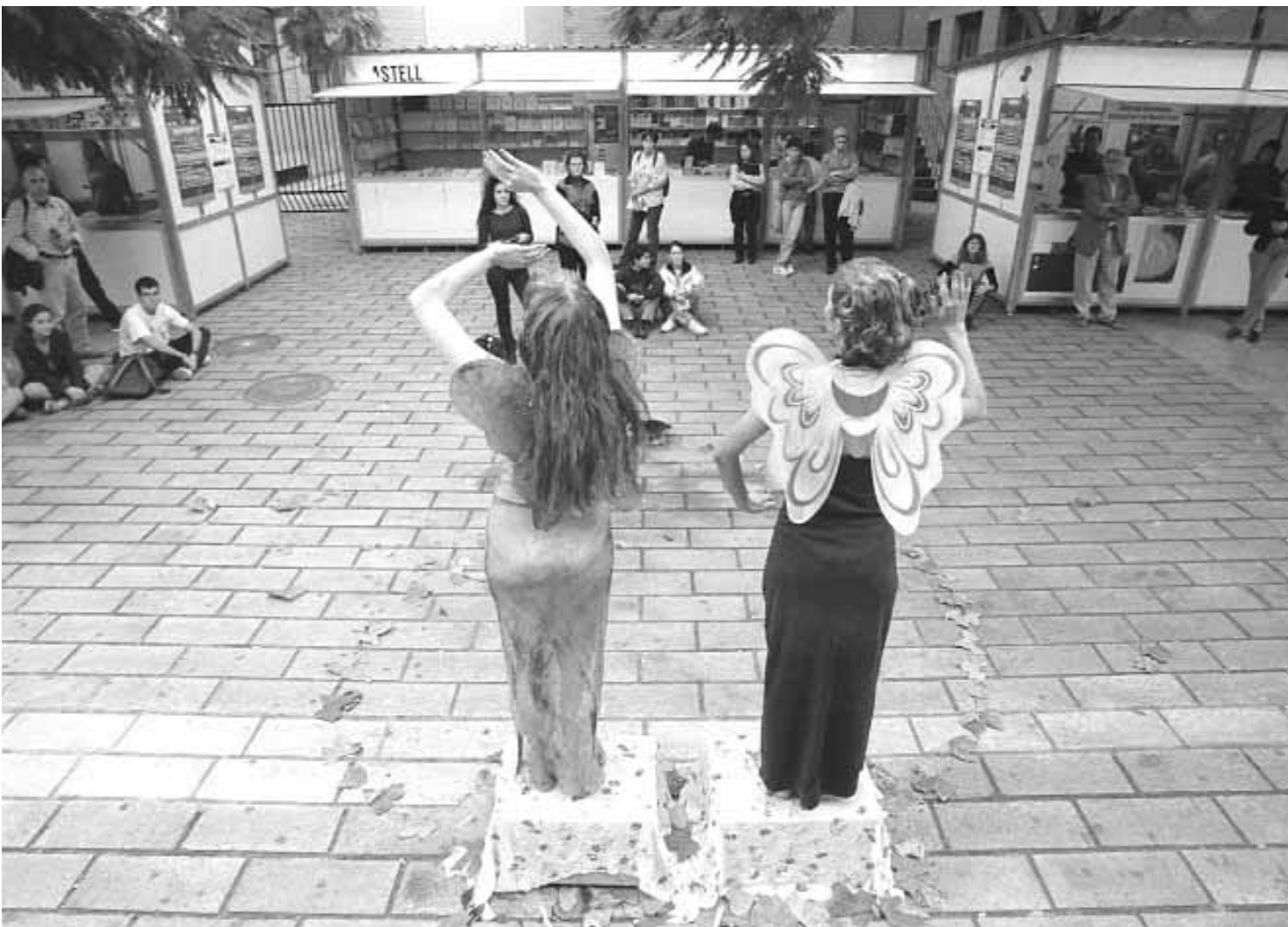
Una 'performance' celebrada aquesta setmana al Campus dels Tarongers.