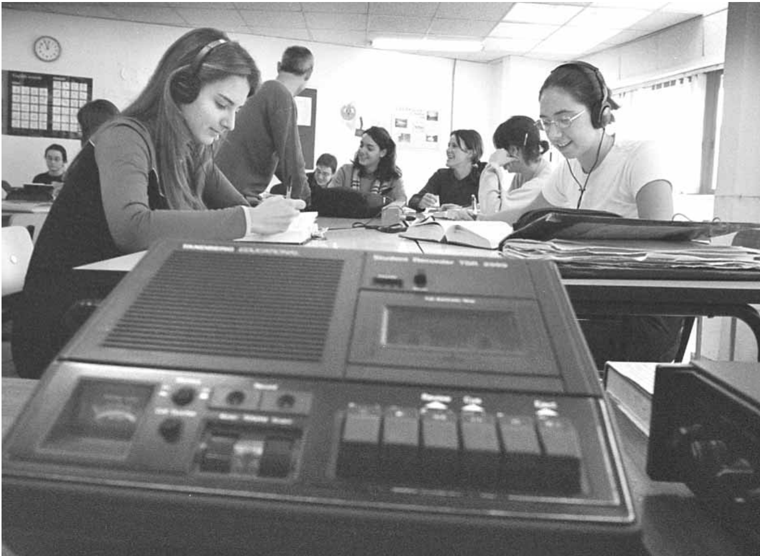
Departament de Didàctica de la Llengua i la Literatura