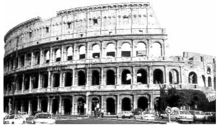
Imatge del Coliseu de Roma.

Durant el regnat de Neró, la seua tendència a esfumar-se i a donar becaines durant els recitals de l'emperador el feu caure en desgràcia i l'obligà, a fi de passar desapercbut, a refugiar-se en una xicoteta ciutat. Una vegada proclamat emperador per les legions orientals, n'hi hagué qui s'encabotà a deïficar-lo, com s'havia fet abans amb els seus predecessors; però ell responia sempre burlant-se dels aduldors. El seu enginy i el seu presumpte caràcter garrepa han proporcionat una de les millors