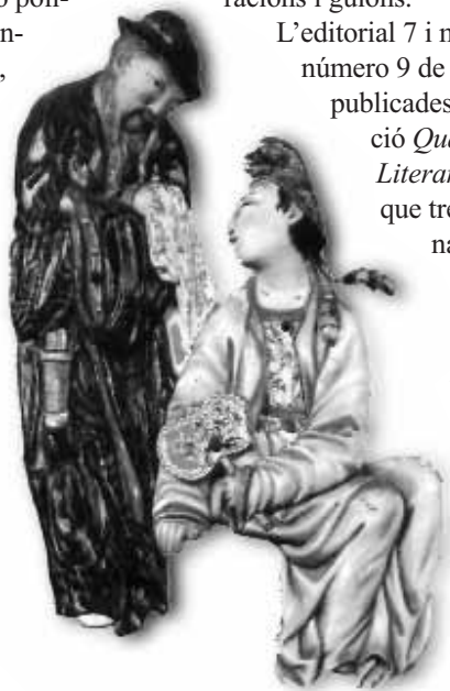
Detall de la portada del llibre L'home tranquil , d'Agustí Peiró.

L'editorial 7 i mig arriba al número 9 de novel·les publicades en la col·lecció Quaderns Literaris , un esforç que trenca l'amenaça constant d'avanç inexorable del desert cultural.