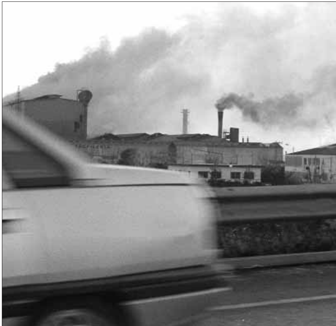
El trànsit i els fums industrials, dos agents destructors del medi ambient.

Dissabte hi haurà la sessió plenària de la posada en comú, amb la participació de tots els congressistes i l'aprovació de les conclusions del III Congrés Internacional d'Universitats pel Desenvolupament Sostenible i el Medi Ambient. La vesprada estarà dedicada a un Seminari sobre Gestió Ambiental a les Universitats i a l'exposició de temes concrets, mentre que el diumenge 21 hi haurà quatre visites guiades entre les quals els participants del Congrés hauran de triar