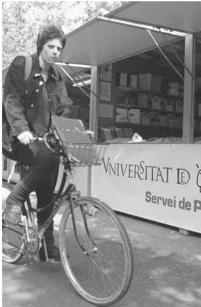
Caseta del Servei de Publicacions a la Fira del Llibre.

L'Associació de Editoriales Universitarias Españolas (AEUE), fundada el 1987, va nàixer amb l'objectiu de fomentar les relacions entre les editorials universitàries. A més de ser un fòrum de debat i d'intercanvi de coneixements i d'experiències, constitueix una via important de difusió de la producció editorial. En l'actualitat està integrada per 46 associats que, tot i respondre a