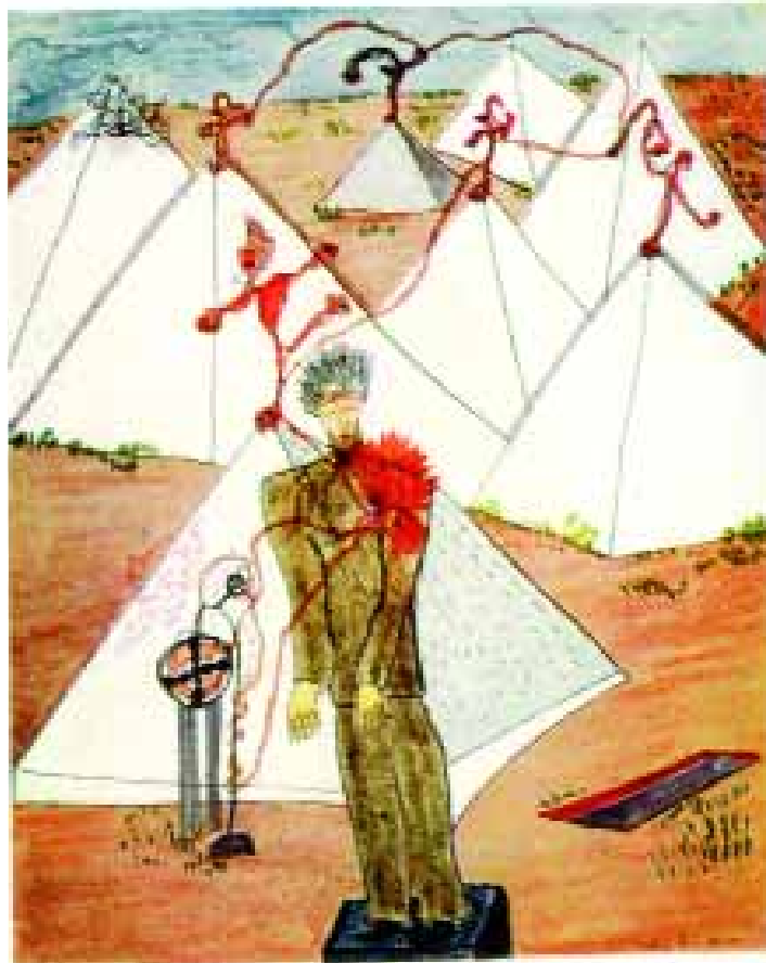
Dalt, dibuixos de F. García Lorca de Poeta en Nueva York editats a Mèxic. A la dreta, portada de la revista Los 4 gatos de gener del 1948.

Mèxic va ser el país que més simpaties va demostrar envers l'Espanya republicana durant la contesa civil