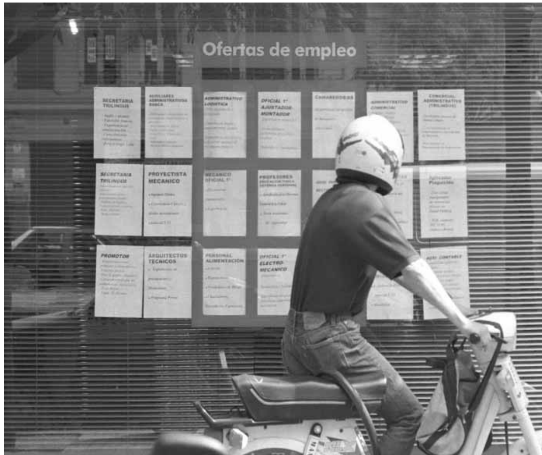
Un jove consulta ofertes d'ocupació en un panell.

En l'actualitat, la Universitat de València compta amb una oficina del Servei Valencià d'Ocupació, ubicada al costat de la Facultat de Psicologia, que va ser inaugurada ara fa dos anys. Aquesta obertura d'agències de la Fundació en l'àmbit universitari "ens ha possibilitat una major especialització en aquest col·lectiu que, segons les dades recollides en l'informe, és sol·licitat