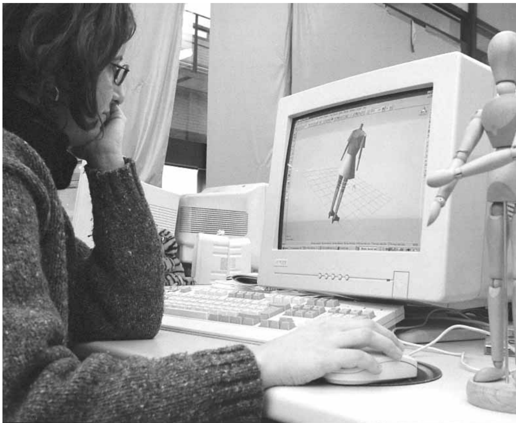
Una investigadora treballa en un projecte de l'Institut de Robòtica.

Permet recrear situacions diverses amb una gran versemblança