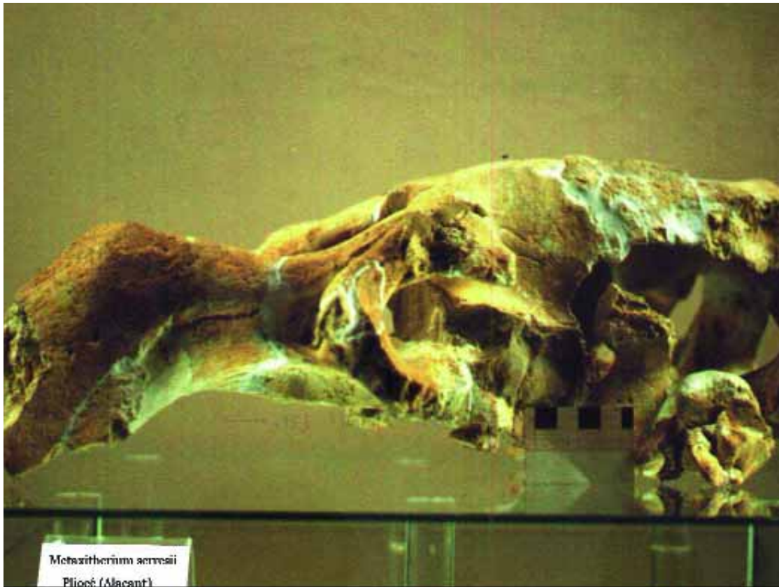
Una imatge del crani de vaca marina localitzat a Pilar de la Horadada.

Tres paleontòlegs han catalogat aquestes restes trobades a Alacant