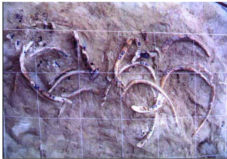
Restes localitzades en una de les excavacions de Crevillent.

La vaca marina és un animal herbívor i habita a zones tropi-