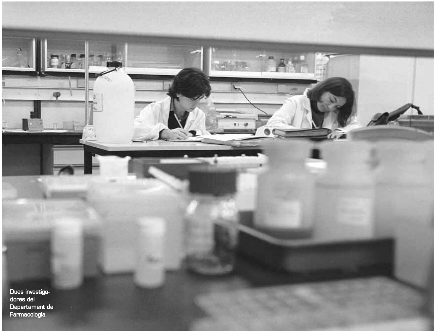
Dues investigadores del Departament de Farmacologia.

Altres dos grups d'investigació s'han encarregat d'identificar i classificar els subtipus de receptors alfa adrenèrgics, dopamínics i histamínics en diversos territoris humans i d'animals d'experimentació per tal d'establir el possible mecanisme d'acció i els efectes de fàrmacs capaços d'unir-se a aquests receptors i la seua repercussió en l'organisme. Paral·lelament, s'han identificat i valorat els