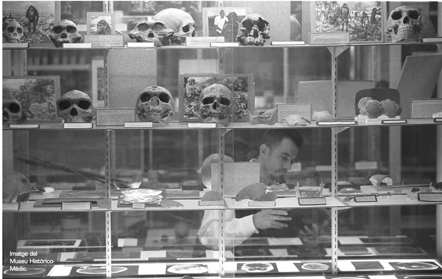
Imatge del Museu Històrico-Mèdic.

El discurs científic sobre el cos humà i les causes de les malalties va canviar molt entre els segles XVI i XVII amb els nous sabers anatòmics i la nova doctrina de la circulació de la sang, fruit d'una mentalitat científica moderna i experimental. Idees i controvèrsies sobre el contagi viu per a explicar l'origen de les malalties infeccioses ocupen també bona part dels estudis de recerca al Departament. Així mateix, és fonamental avaluar la recepció de les noves teories científiques i la seua relació amb els corrents de pensament europeus. En aquest sentit, cal destacar la correspondència entre científics d'al-