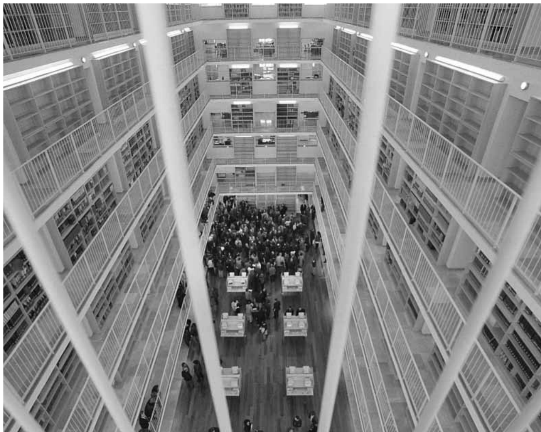
Biblioteca Gregori Maians del Campus dels Tarongers.

La Biblioteca Gregori Maians ha posat en marxa la iniciativa