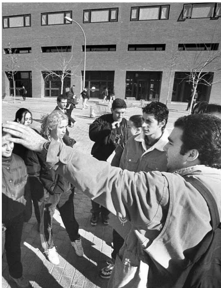
Un monitor i un grup d'estudiants preuniversitaris al Campus dels Tarongers.

D'aquesta forma, a la Universitat de València accediran alumnes de tot tipus de centres, tant públics com privats, d'arreu del País Valencià, però també de les comunitats autònomes properes que volen estudiar a les comarques valencianes. A aquests alumnes que vénen de més lluny i que mai no han tingut contacte amb la Universitat és a qui principalment s'adreça el programa Conéixer . "No és a la gent que viu a València i ja l'ha visitada, o que fins i tot ha emprat els nostres serveis, sinó a la gent que viu a Xàtiva, Alcoi o Vilallonga, entre altres localitats". En aquest programa col·labora el Servei de Normalització Lingüística, el qual organitzarà-coor-