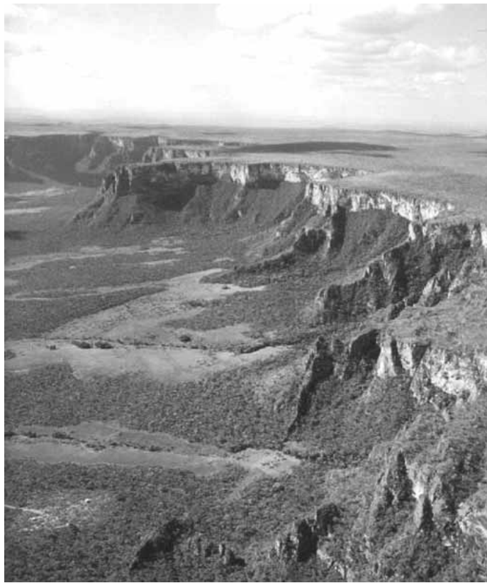
Paisatge del Mato Grosso brasiler, d'on és bisbe monsenyor Casaldàliga.

sió de la seua parròquia foren els cadàvers de quatre xiquets ficats en unes caixes de sabates que algú va deixar en la porta de sa casa. Uns dies més tard, en acabar la missa, el van avisar que un xicot s'havia penjat d'una biga. Després de despenjar-lo, escorcollà les seues butxaques i no hi va trobar cap nom, ni una adreça, res. El va enterrar amb l'ajuda d'altres homes aparentment embrutits, però que eren capaços d'apiadar-se d'un desconegut. Amb aquests antecedents i, sent un home honest, no és d'estranyar que, en plena dictadura militar, redactara un document titulat Esclavitud i feudalisme al nord del Mato Grosso . El document va resultar un escàndol i va provocar, junt amb diverses actuacions directes en suport als camperols, que els terratinents arribaren a