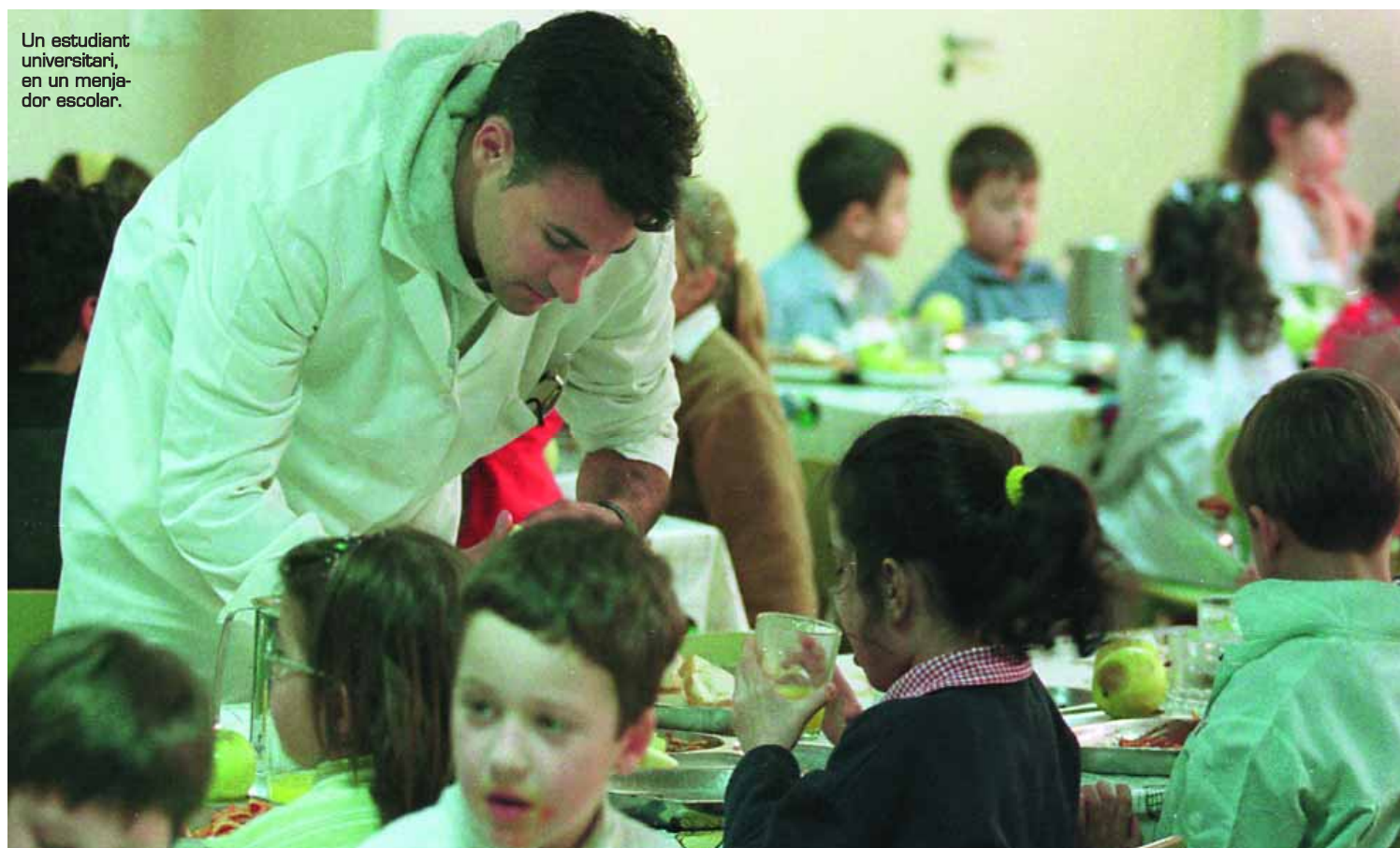
Un estudiant universitari, en un menjador escolar.