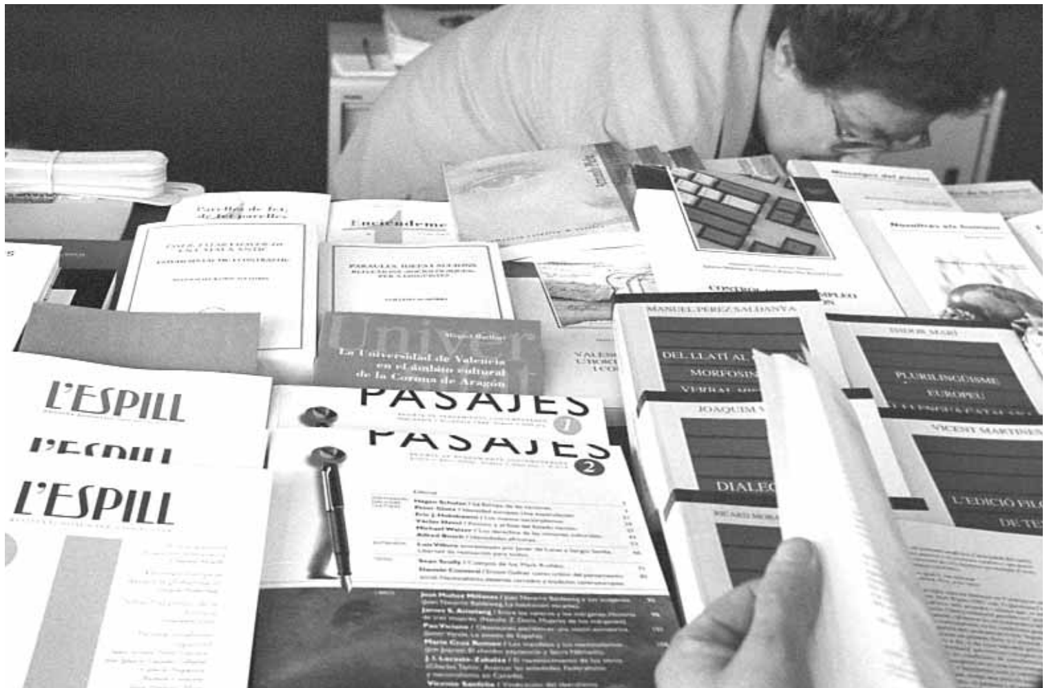
Libres exposats a la caseta de la Universitat a la Fira del Llibre.

En l'acte d'obertura de la XXXI Fira del Llibre de València, a la caseta de la Universitat també van intervenir el vicerector de Cultura