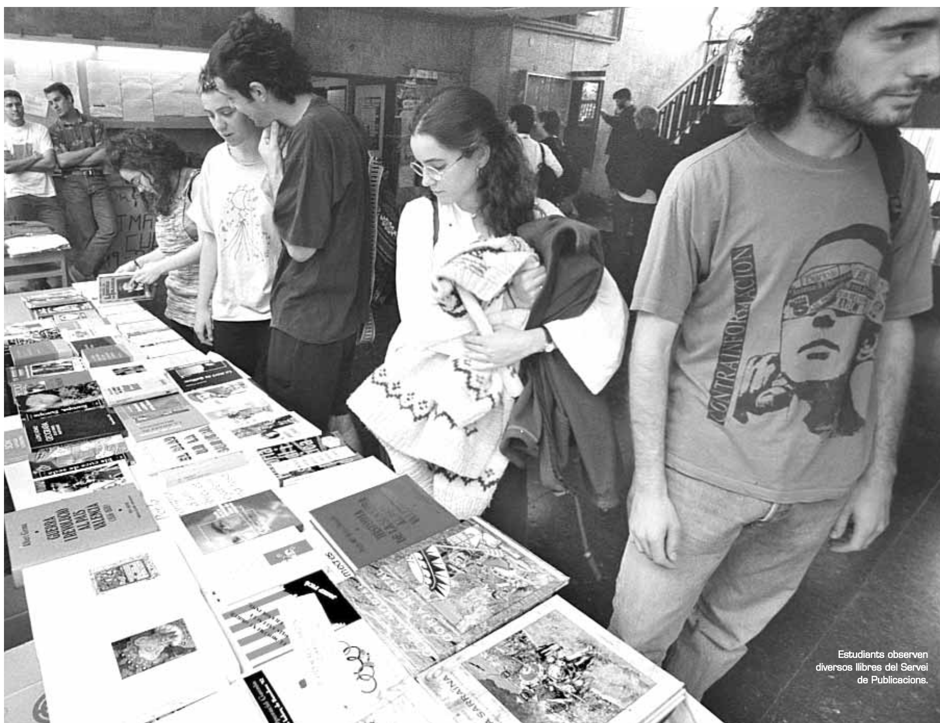
Estudiants observen diversos llibres del Servei de Publicacions.