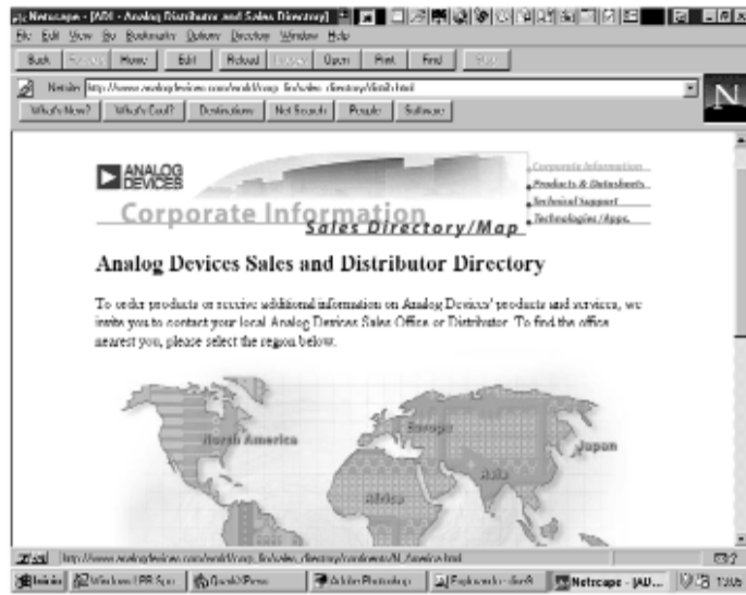
Imatge de la pàgina web corporativa de l'empresa Analog Devices.

La visita està motivada per tres raons: la manca de mà d'obra qualificada a Irlanda; la immillorable impressió que antics alumnes de la titulació