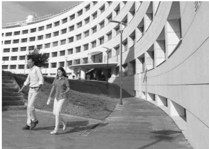
Edifici Jeroni Muñoz finançat amb fons FEDER.

La Universitat de València ha tingut un notable grau de participació en la convocatòria i s'ha emportat un 30% del total d'aquests fons. L'èxit ha estat també per a les empreses col·laboradores, les quals contribuiran al desenvolupament dels projectes amb l'aportació de quasi 100