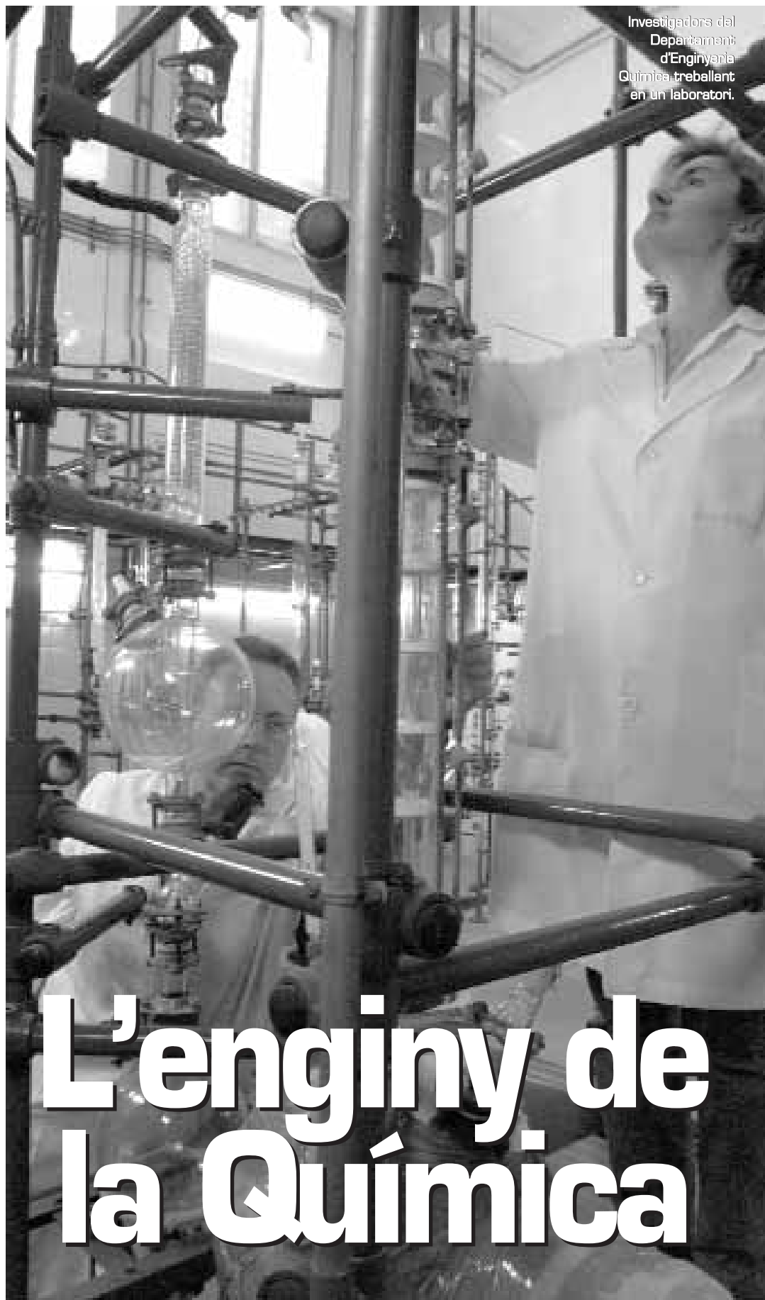
Investigadors del Departament d'Enginyeria Química treballant en un laboratori.

Una tercera unitat integra els investigadors interessats pel tractament d'aigües. En aquest sentit,