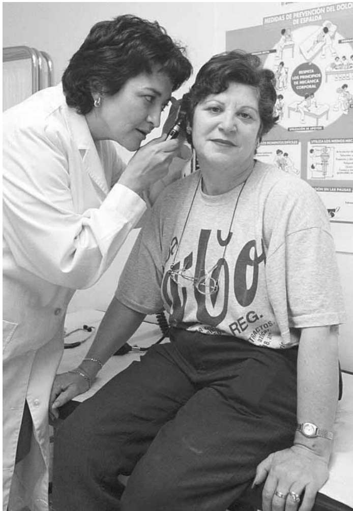
La metgessa del Gabinet examinant una pacient.

Els gabinets de salut laboral acosten la prevenció, l'assistència sanitària i la promoció de