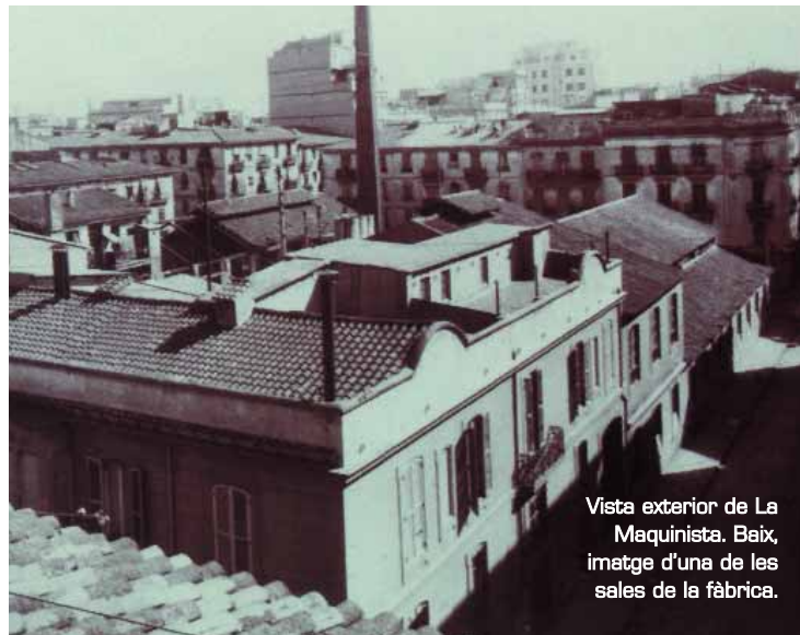
Vista exterior de La Maquinista. Baix, imatge d'una de les sales de la fàbrica.

S i el passat divendres s'haguera realitzat una estadística sobre l'ofici i els cognoms del llarg centenar de persones que pul·lulaven per la Sala de la Muralla del Col·legi Major Rector Peset, saltarien a la vista dues dades significatives: per una banda, majoria historiadors; i per una altra, majoria de persones cognomenades Climent. En aquest cas l'estadística ens hauria aproximat a la naturalesa del conclave que allí s'estava celebrant. El congrés sobre el segle XX organitzat per l'Associació d'Història Contemporània i la Universitat de València en la commemoració de Cinc Segles