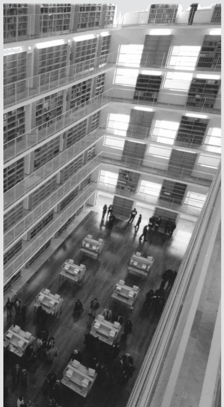
La Biblioteca de Ciències Socials de la Universitat.