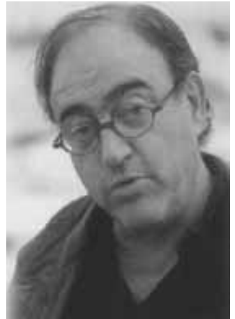
Dalt, el compositor Carles Santos. A l'esquerra, imatge de l'Orquestra Filharmònica de la Universitat de València.

ha sigut elegit com a millor espectacle musical de l'any 2000 dins dels Premis de la Crítica de Barcelona. Santos també ha rebut aquest any passat el Max a la millor banda sonora de teatre pel Hàmlet de Lluís Homar, presentat en el Grec 99.