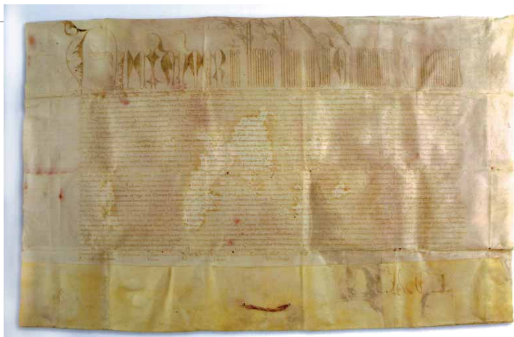
Butlla fundacional de la Universitat de València, signada per Alexandre VI el 23 de gener de 1501.

[...] La comunitat dels fills dilectes de la ciutat de València acaba de presentar-nos una sol·licitud exposant que si en la dita ciutat, que del regne és cap i casal i insigne i noble entre les altres ciutats d'aquelles parts, i cap a la qual concorren nombroses gents de tot arreu, tan eclesiàstiques com seculares, floris un estudi general literari en el qual es poguessen ensenyar totes les facultats lícites, moltíssimes persones d'aquella ciutat i regne i d'altres parts es dedicarien de grat a l'estudi literari i es farien erudits, i això redundaria extraordinàriament no sols en honor i prestigi de la ciutat i en el govern i utilitat de la cosa pública sinó també en la salvació de les ànimes.