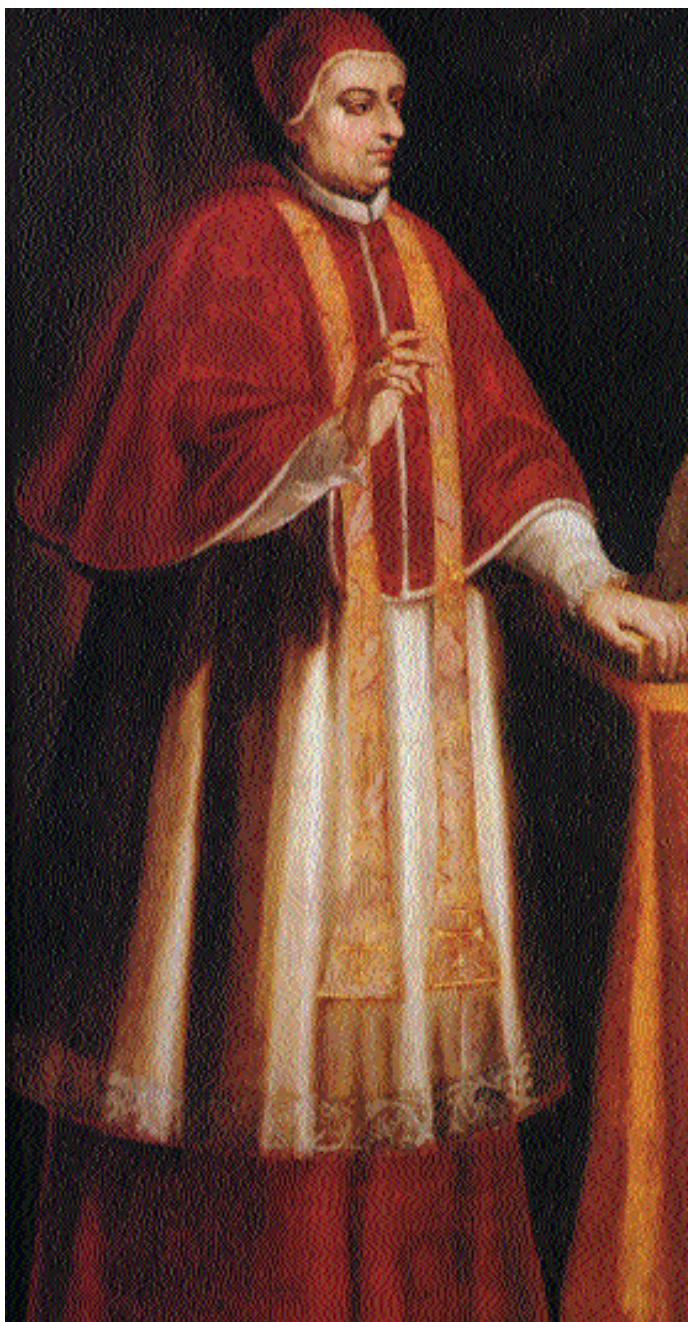
Alexandre VI, en un retrat ubicat al Paraninfo de la Universitat. Dalt, detall de la Butla. Davall, detall del coronament de la butaca rectoral al Paraninfo, on apareix l'emblema històric de la Universitat de València amb l'escut del papa Alexandre VI junt amb el del rei Ferran el Catòlic.

cipa dels actes borgians amb tot un seguit d'activitats que ens acosten a la família valenciana més universal.