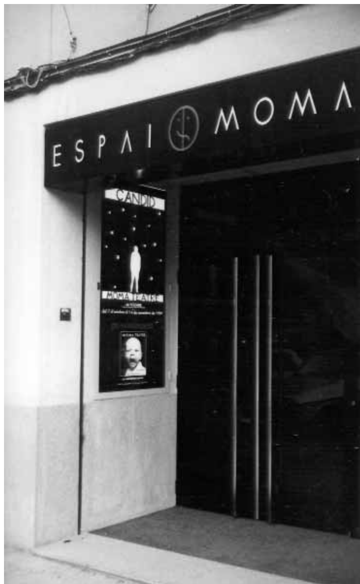
L'Espai Moma inaugura la temporada de representacions amb una obra de R.W. Fassbinder i una altra de George Tabori.