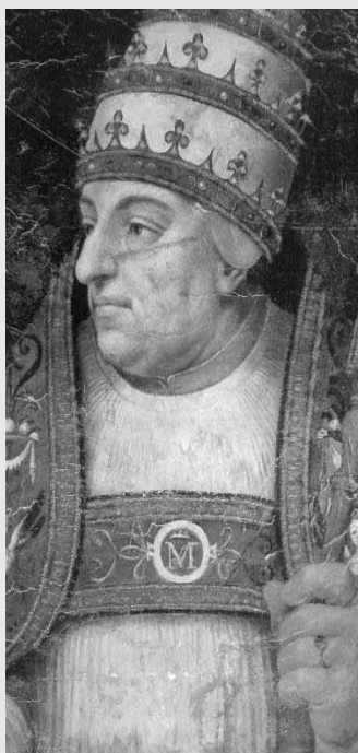
Alexandre VI, pintat per Joan de Joanes (Catedral de València).

D'altra banda, la germana de Calixt III, Isabel de Borja, es casa amb el xativí Jofré de Borja, aquests seran els pares del futur Alexandre