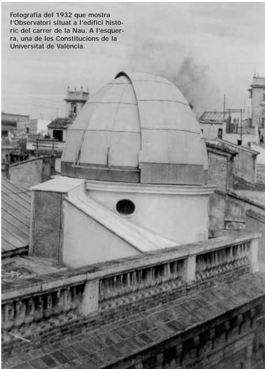
Fotografia del 1932 que mostra l'Observatori situat a l'edifici històric del carrer de la Nau. A l'esquerra, una de les Constitucions de la Universitat de València.