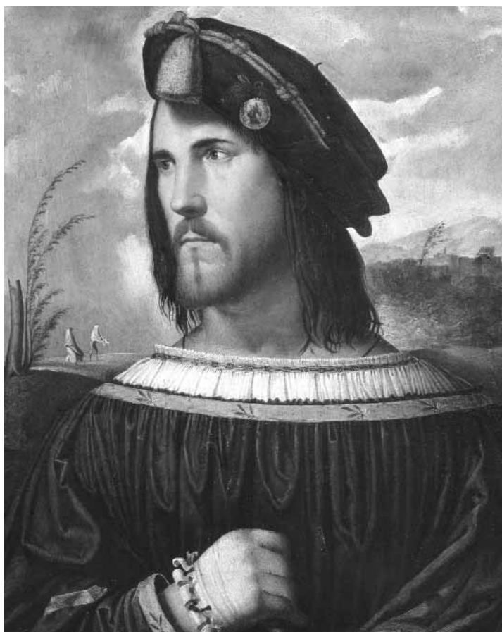
César Borja, en una pintura atribuïda a Giorgone.

ELS HUMANISTES VALENCIANS. Els valencians il·lustres que hi havia a la cort dels Borja