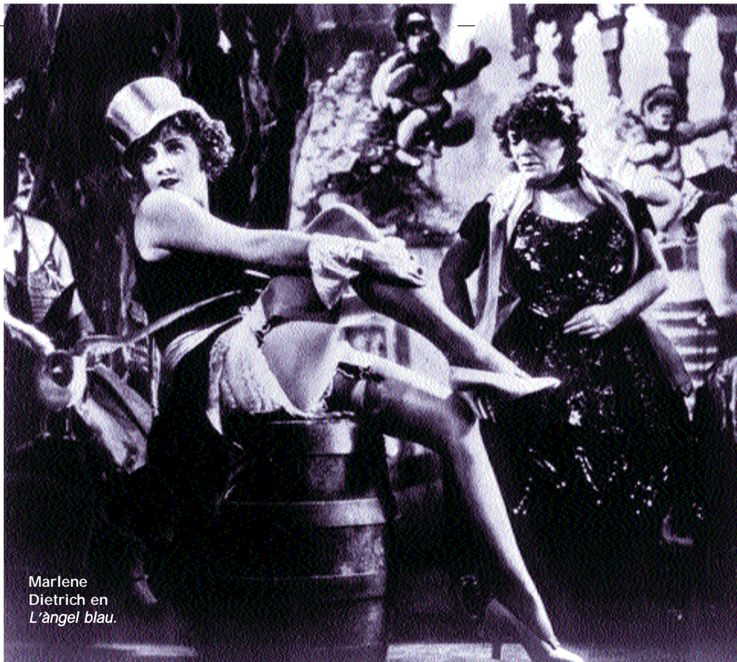
Marlene Dietrich en L'àngel blau .

Les actuacions musicals posaran el colofó a l'exposició, oberta al públic al Centre Cultural La Benificència. La mostra utilitza els mitjans audiovisuals per acostar-se als visitants i transmetre una idea de la llengua i la cultura alemanyes amb jocs interactius. S'hi pot escoltar, per exemple, fragments de música alemanya, tant dels gran clàssics com de Beethoven, Schubert o Haydn, com també d'autors més actuals. També es podran llegir fragments de poesies, veure pel·lícules que han marcat una època ( Metropoli , El pont , L'àngel blau ), escoltar fragments de concerts, contemplar obres de pintors alemanys, programes de televisió i videoclips i, fins i tot, un recull dels millors anuncis fets a Alemanya en cinquanta anys. El públic té la possibilitat de demostrar la seua per-