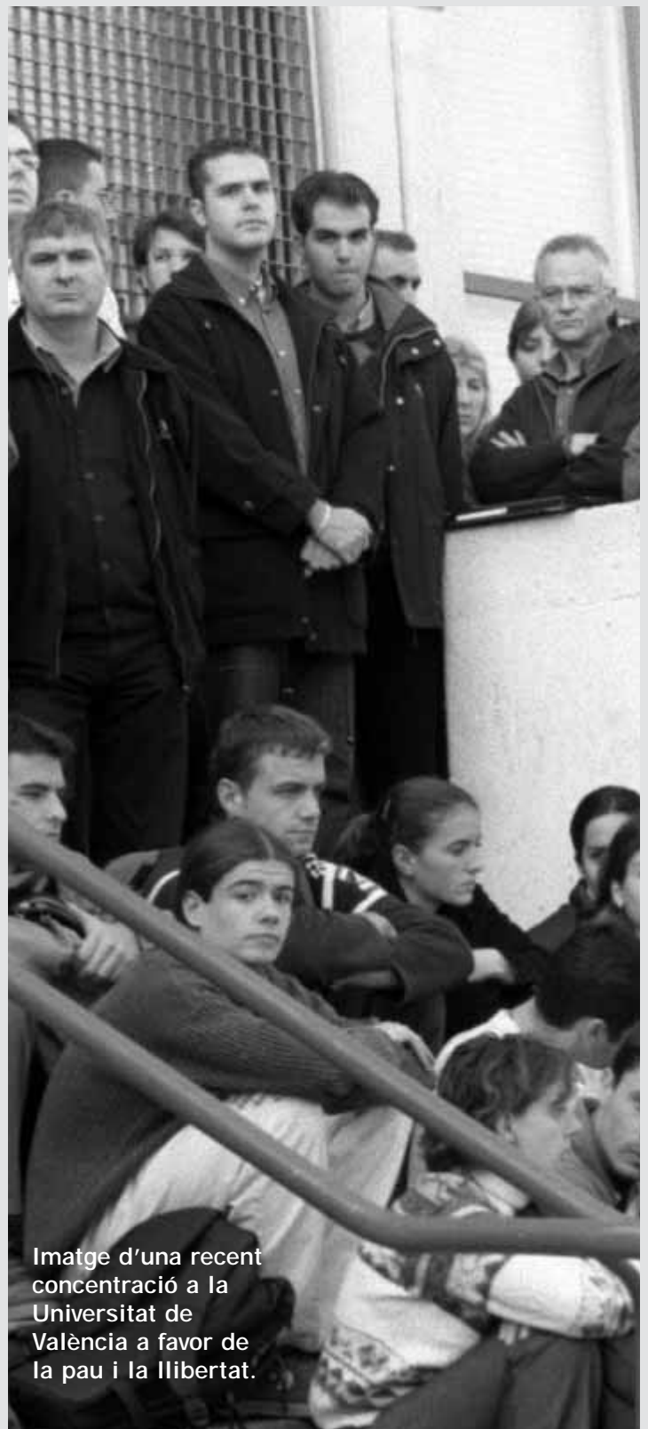
Imatge d'una recent concentració a la Universitat de València a favor de la pau i la llibertat.