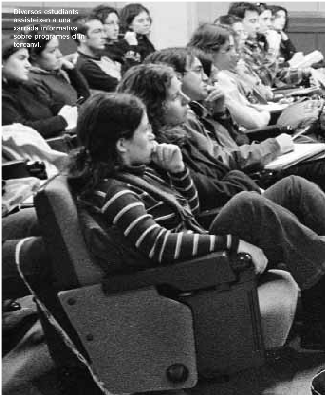
Diversos estudiants assisteixen a una xarrada informativa sobre programes d'intercanvi.

Cada any són més els estudiants que se sumen a aquests programes perquè el coneixement d'idiomes és una eina fonamental dins del