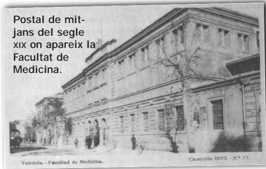
Postal de mitjans del segle XIX on apareix la Facultat de Medicina.