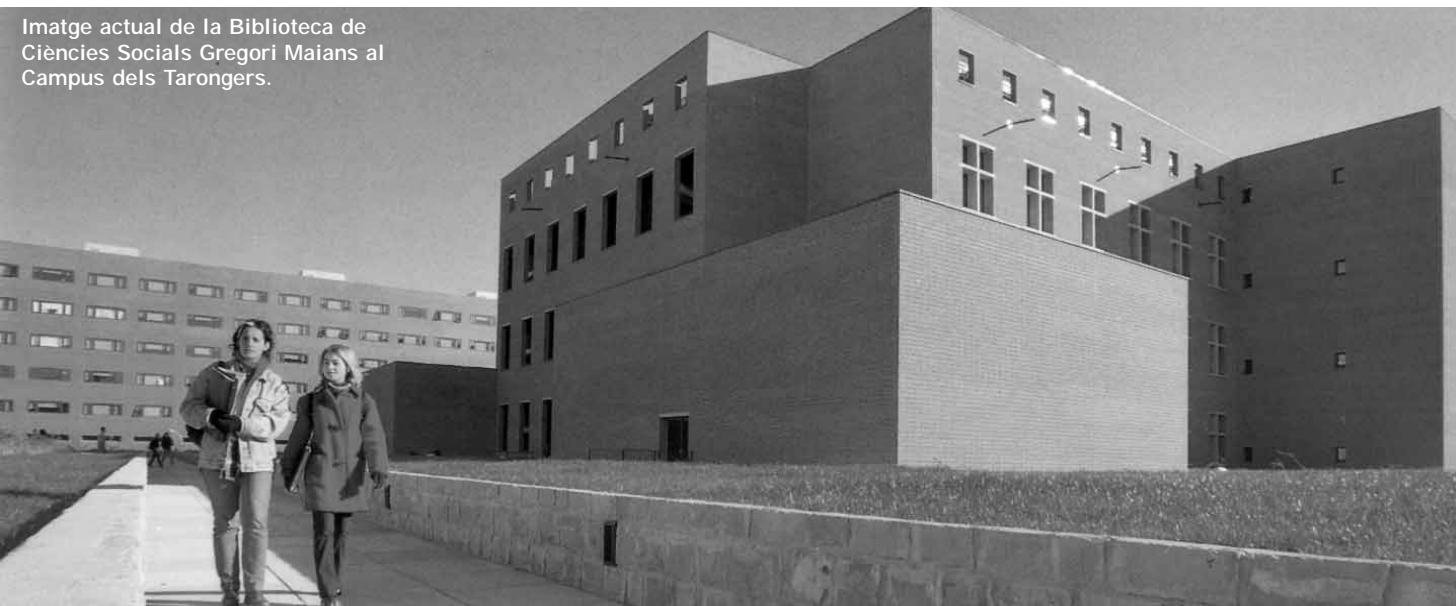
Imatge actual de la Biblioteca de Ciències Socials Gregori Maïans al Campus dels Tarongers.

A partir de la setmana vinent, serà la Universitat la protagonista dels fascicles de Levante-EMV .