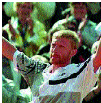
Boris Becker, a l'esquerra, i Friedrich Nietzsche.

El Col·legi Major Rector Peset acollirà els dies 14 i 16 de febrer dues actuacions musicals com a cloenda de l'exposició Descobrir l'alemany